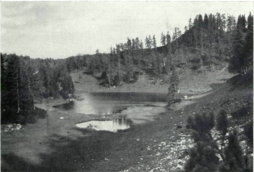
Abb. 4: Krallersee