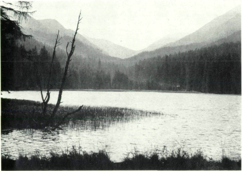
Abb. 1: Ingeringsee