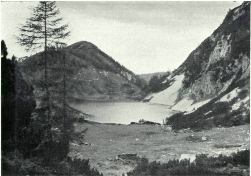
Abb. 2: Schwarzensee