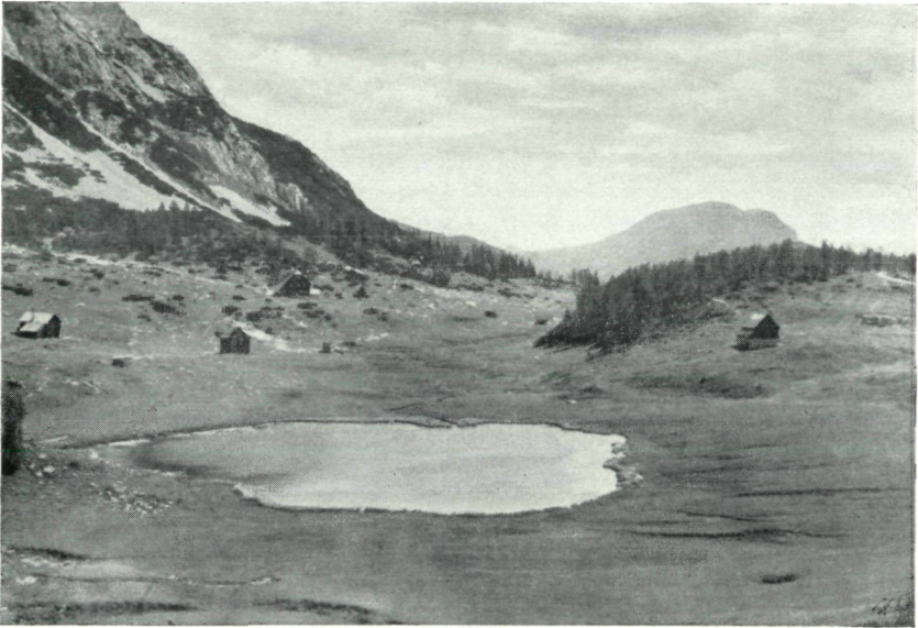
Abb. 3: Gwändlsee