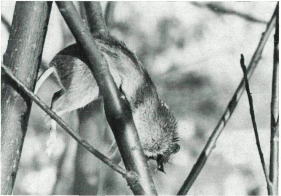
Abb. 3: Typische Beute des Raubwürgers: Feldmaus in einer Astgabel.