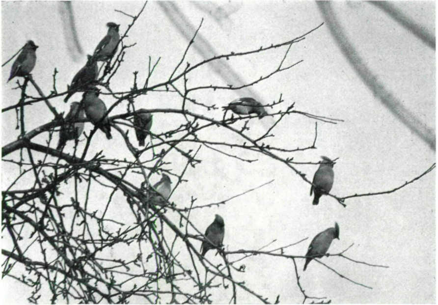
Abb. 3: Seidenschwanz, Bombycilla garrulus (L.); in diesem Jahr sehr häufiger Wintergast in der südl. Steiermark (Foto H. SKRINGER).

Zilpzalp, Phylloscopus collybita (VIEILLOT): Erste Frühjahrsbeobachtung am 9. 3. 1975 (2) in Gralla; letzte Herbstbeobachtung am 20. 11. 1975 (1) in Bachsdorf.