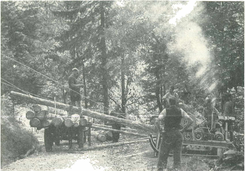
Abb. 3. Das aufgeseilte Bloch wird mit Hilfe des Seilgerätes auf den Blochwagen verladen.

Dazu wurde es zunächst mittels einer Motorplätte über den Traunsee zum Lainauaufsatz und von hier in 4 Einzellasten zerlegt mit einem leichten Materialaufzug über die Lainautstiege zur Lainauhöhe befördert. Dort besteht die Aufgabe, das entlang der Lainaustraße unterhalb dieser anfallende Fichten-, Buchen- und Lärchen-Nutzholz in plenterweiser