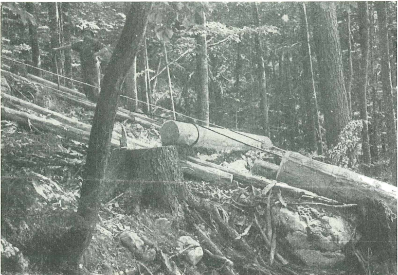
Abb. 2. Starkes Bloch unmittelbar vor dem Aufseilen bereits am Zugseil befestigt. Das Rückholseil läuft oberhalb des Bloches.

strecke von 650 m zu bringen. Da es nicht ratsam ist, längere Bringungsstrecken als 350 m im Bodenschleppverfahren zu bearbeiten, erwiesen sich hier 2 Aufstellungen des Gerätes als notwendig. Bei der ersten Aufstellung wurde das gesamte Holz von der Schlagfläche weg auf ein Zwischenganter vorgerückt, während von der zweiten Aufstellung aus der Weiter-