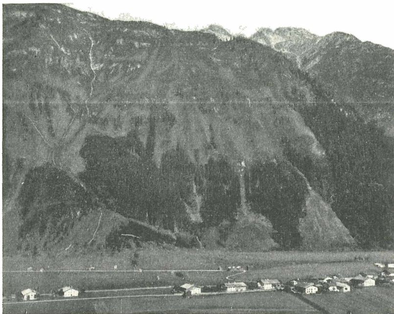
Abb. 1. Entwaldete Hänge des Heuberges nordwestlich der Gemeinde Häselgehr im Lechtal.

Ein typisches Beispiel für den Waldrückgang im Lechtal ist im nordwestlich der Gemeinde Häselgehr gelegenen Heuberg gegeben. Die Hänge dieses Berges sind durchwegs südlich exponiert, äußerst steil und sind von den Gipfelhöhen (etwa