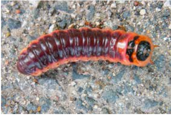
Weidenbohrraube (unberochen) bei Coburg

Kompendien Bayerns und wohl auch Deutschlands. Die Ascomycetenfunde und -fotos von Bernd Hanff, die in dieser Reihe erschienen sind, verdienen – um nur einen kleinen Aspekt hervorzuheben – nach wie vor größten Respekt. Wie oft komme ich mir, wenn ich einen seltenen Pilz entdeckt habe, vor wie der Hase im Wettlauf mit dem Igel: Nix Neufund Bayern – „PFNO“ war schon da! Allen, die das Werk Engels und