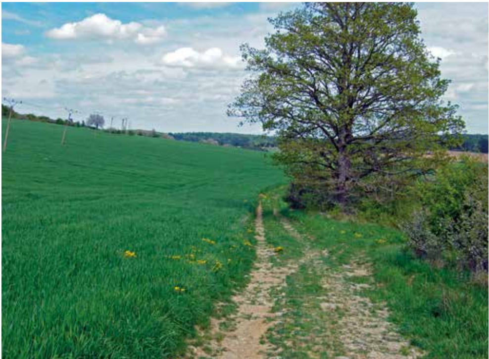
Orientierungs-GAU vor Gauerstadt: Augen auf und durch

Nachdem ich mich hinter Coburg wieder einmal arg verfahren hatte – war die Radwegbeschilderung zu schlecht oder ich einfach zu blind, um sie zu erkennen? – erspähte ich nach vielen Umweg-Kilometern über Wald-, Wiesen- und Holzwege am