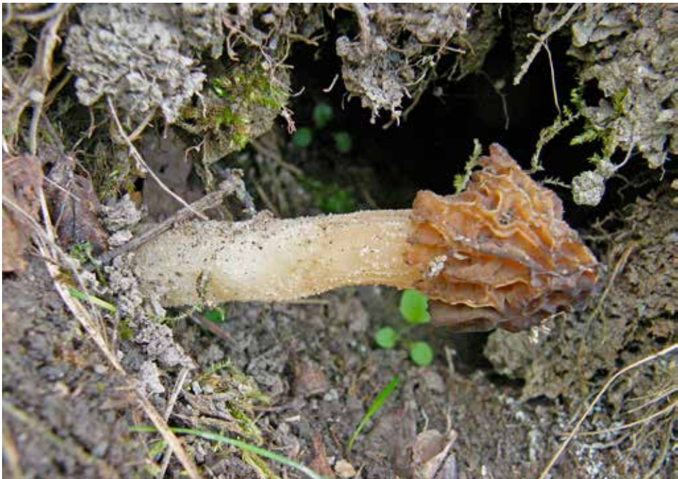
Käppchenmorchel ( Morchella gigas ) in der Waagerechten bei Neumarkt/Opf

In den folgenden Tagen sollte mich wiederholt ein anderer Bauchpilz auf sich aufmerksam machen, doch auf den komme ich noch zurück. Zuvor erinnere ich mich mit Freude an den viele Kilometer langen, mit schattigen Bäumen gesäumten alten Ludwig-Donau-Main-Kanal, ein grünes Band der Naherholung, und an die Käppchenmorcheln ( Morchella gigas ), die bei Neumarkt/Oberpfalz im 90-Grad-Winkel aus der Wegböschung ragten wie kleine Silvesterraketen, gerichtet auf die Speichen der Vorbeiradelnden.