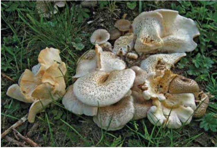
Überraschung am Donauradweg vor Weltenburg: Lentinus tigrinus

Der Umweg führte mich durch einen Weiler, der wie eine bekannte Kreisstadt im Bayerischen Wald heißt, aber nur aus ein paar Häusern besteht – und da stand sie vor mir unter einem Apfelbaum, vor radelnden Gourmets und Mykologen geschützt durch einen stabilen, hohen Zaun: die einzige selbstentdeckte Speisemorchel der Tour – was ich zu dem Zeitpunkt natürlich noch nicht wissen konnte. Ich begrüßte sie wie eine alte Freundin.