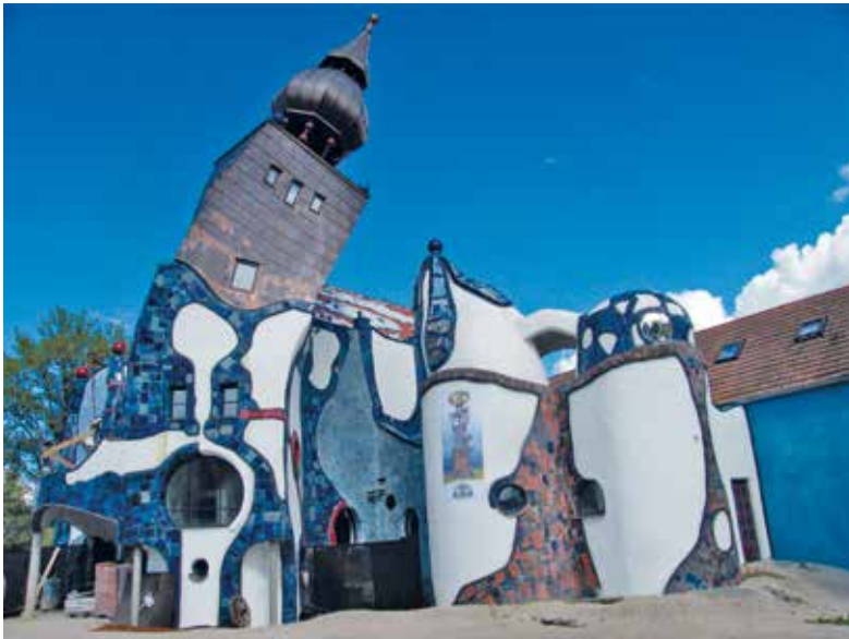
Kultur am Wegesrand: Die Hundertwasser-Kirche in Abensberg

In Landshut begleitete mich ein guter Pilzfreund mit dem Rad zur Stadt hinaus und zeigte mir noch, wie es weiterging. Kaum hatten wir uns verabschiedet, bog ich an der nächsten Weggabelung falsch ab. Der Umweg, den ich fahren musste, war überschaubar, ja, er passte irgendwie auch zu meiner Streckenphilosophie: Nur ja nicht immer stur den Schildern der Radwegplaner folgen, sondern durchaus manchmal der Sonne, dem Hinweis auf eine Sehenswürdigkeit oder schlicht einer Eingebung, mal durch einen Wald, in dem ich nie war, mal über einen Feld- oder Wiesenweg oder durch ein verträumtes Bachtal abseits der Fahrradmagistralen.