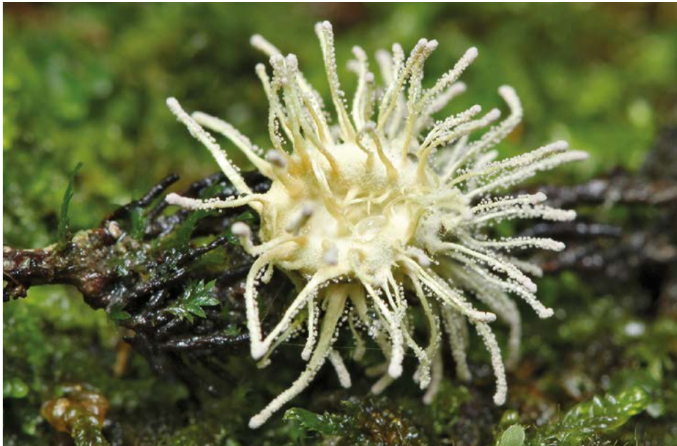
Abb. 1: Torrubiella arachnophila