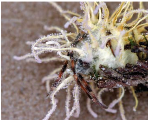
Abb. 2: Torrubiella arachnophila mit freiliegenden Beingliedern einer unbekanntes Spinnenart.