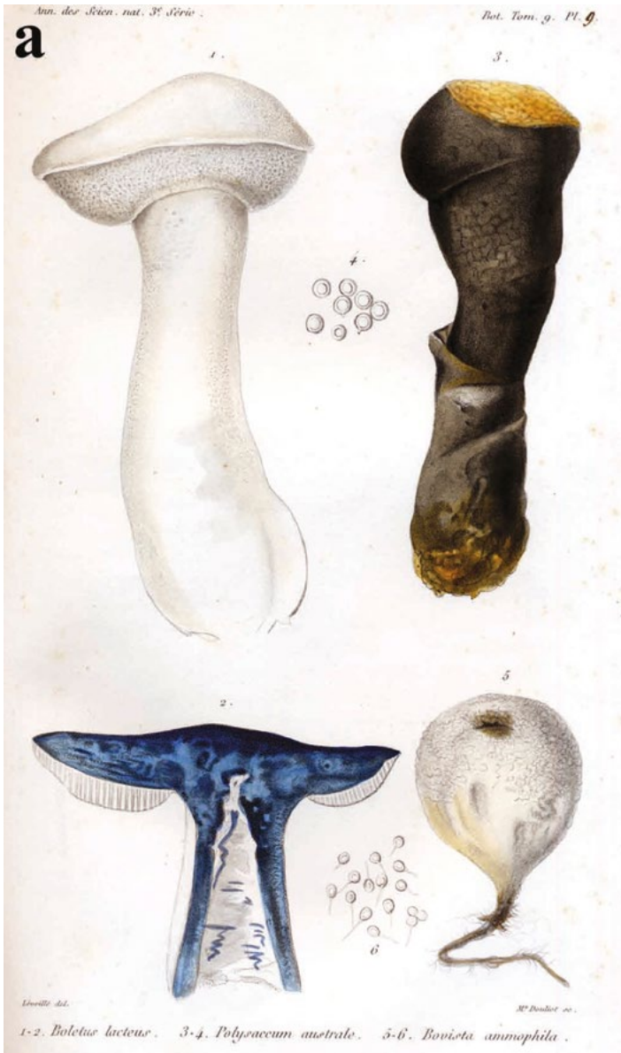
Abb. 2 – Iconotypus von Gyroporus lacteus (LÉVEILLÉ 1848: plate 9, 1-2) – ohne Scheinringzone und mit auffallend langstieligem Fruchtkörper und glattem, weißen Hut.

Es gibt aber ein Problem... Da bei der Epitypisierung von Gyroporus lacteus noch nicht klar war, dass es eine zweite, ähnliche Art gibt, wurde leider nicht darauf geachtet, eine Kollektion auszuwählen, die auch wirklich der Originaltafel entspricht. Die Originaltafel von Gyroporus lacteus (Abb. 2) zeigt nämlich genau den Habitus, der der neuen Art Gyroporus pseudolacteus zugeschrieben wird, nämlich einen langstieligen Fruchtkörper (!) und einen glatten, blassen, weißen Hut!