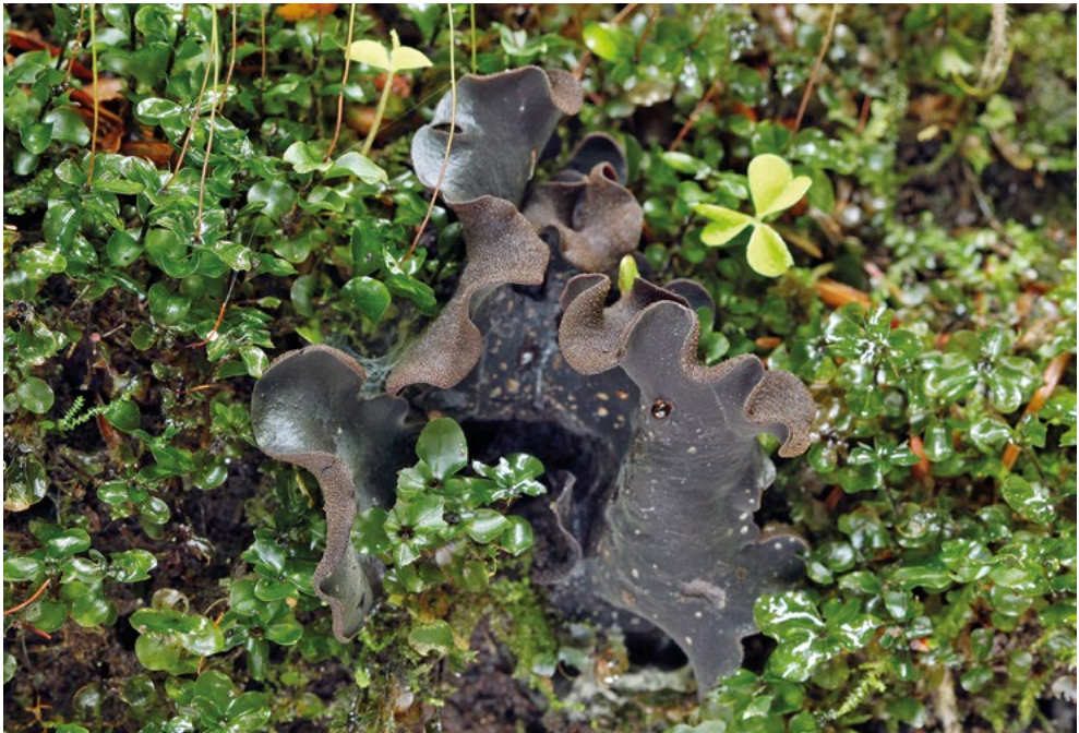
Abb. 3 – Ionomidotis irregularis vom 04.09.2015