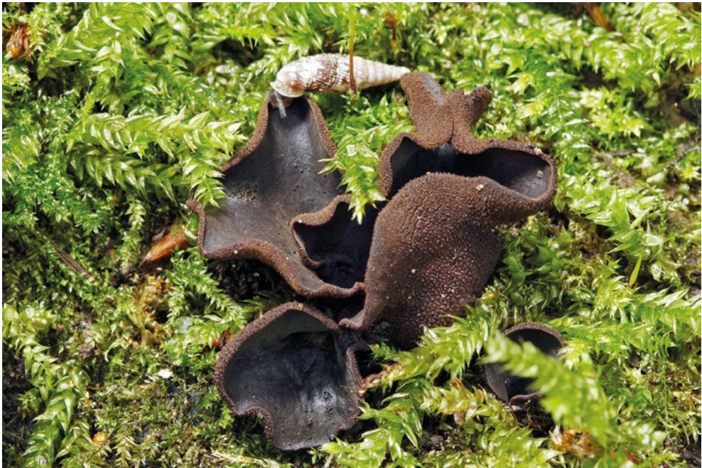
Abb. 1 – Ionomidotis irregularis vom 10.09.2013