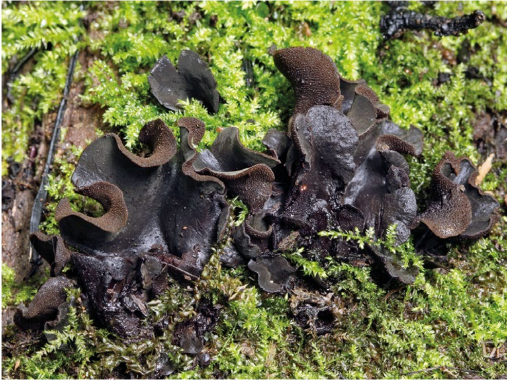
Abb. 2 – Ionomidotis irregularis vom 10.09.2013