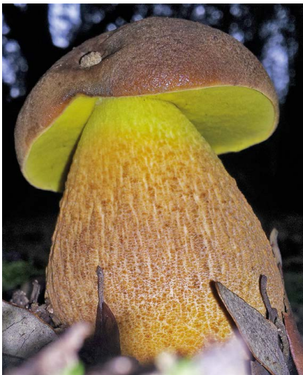
Abb. 10 – Leccinellum cf. aberrans , 15.11.2015 Italien, Sardinien, Villagrande, Boso di S. Barbara. Gut zu erkennen sind die jung bereits braunen Stielschüppchen und die dunkle Hutfarbe. Da kein Beleg vorhanden ist und der Fruchtkörper zu jung für die Ermittlung der Sporenmaße ist, kann die Bestimmung nicht endgültig verifiziert werden.