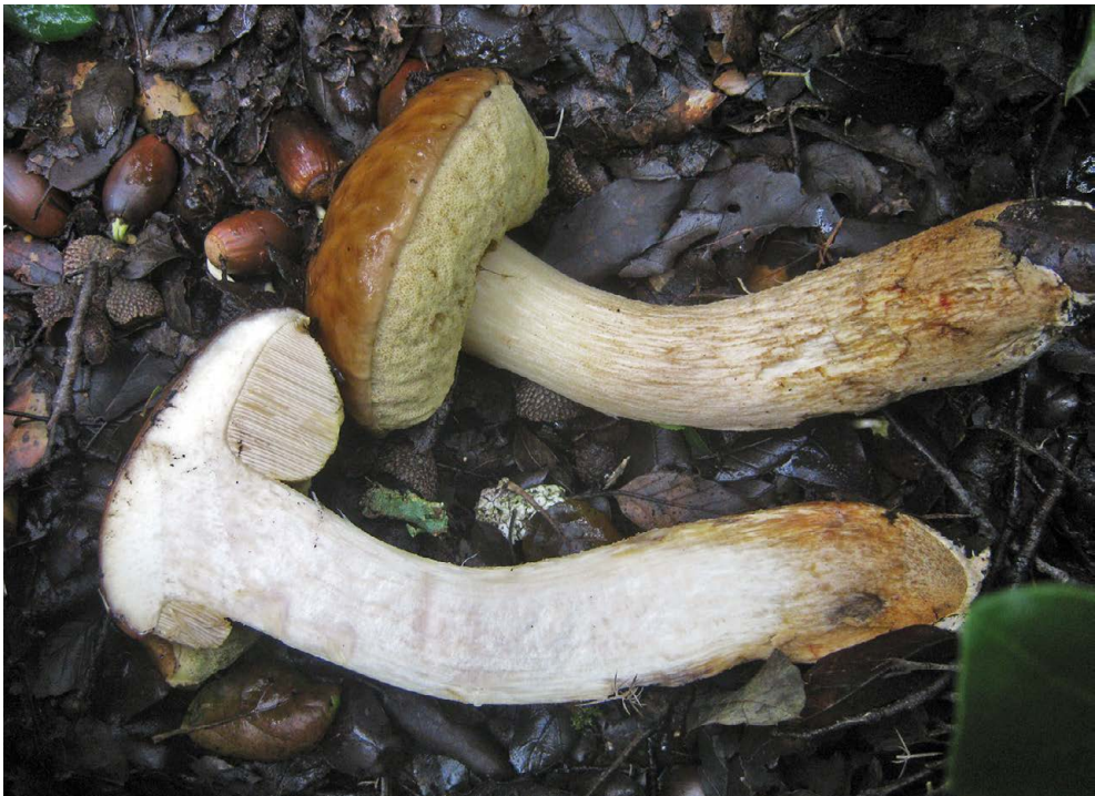
Abb. 7 – Leccinellum tlemcenense . Portugal, Lisboa, Parque de Monsanto, 14.1.2014. Fleisch und Röhren sehr blass, Poren deutlich gelb, Hut schmierig.