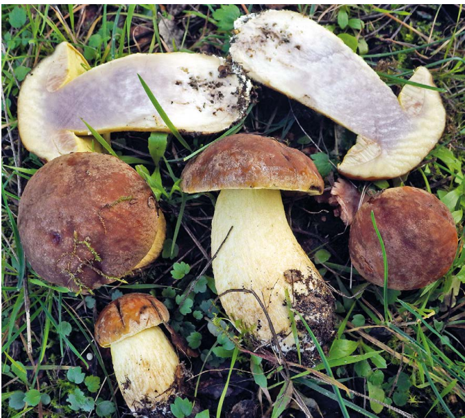
Abb. 9 – Leccinellum tlemcenense. Portugal, Lisboa, Parque de Monsanto, 23.1.2016. Poren leuchtend gelb, deutlich zu den blassen Röhren kontrastierend. Das blasser Fleisch verfärbt bereits.