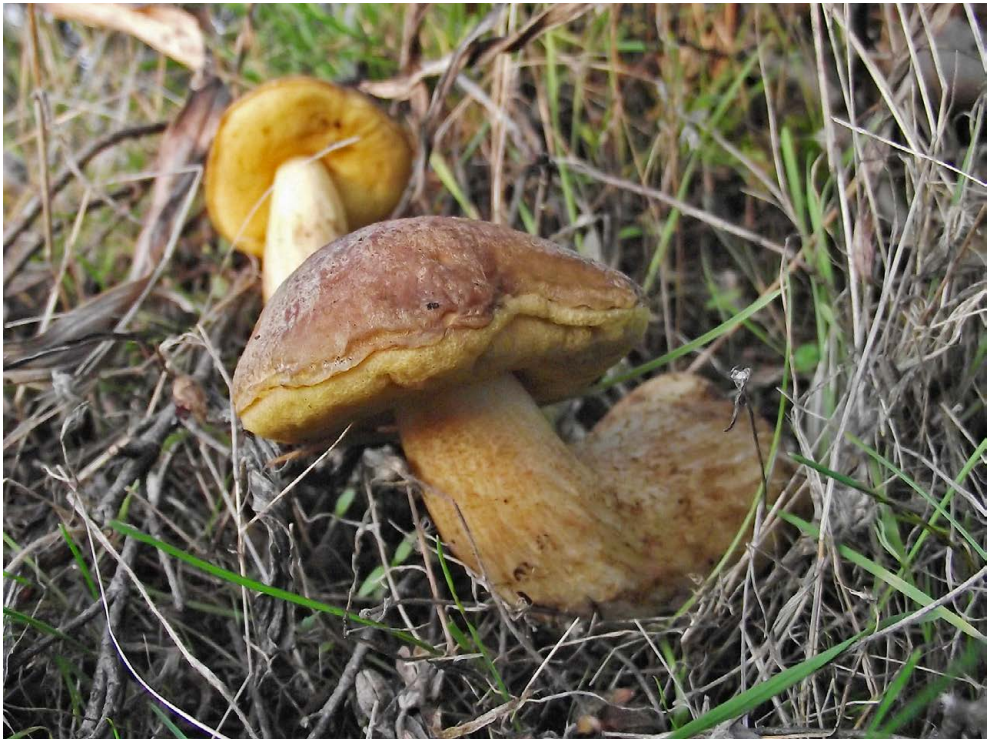
Abb. 4 – Leccinellum corsicum. Italien, Sardinia, Montecresia, bei Cistus monspeliensis. 14.3.2018.

Lateinische Diagnose: „ Pileus 2,5-5 cm, e convexo in hemisphaerium vergens, brunneus, cuius cuticula rimas facile agit. Stipes 3,5 x 1-1,6 cm, ventricosus, radicans, cum granulis aurantiacis quae paulatim brunneola fiunt et cristas efficiunt per totum stipitem distributas. Tubuli adnata aut subdecurrentes, 0,7-1,2 cm longi, flavi; poris flavescences, angulosi, 0,5-1,2 mm lati. Caro incisione rosea in stipitis apice nec non circum pileum. Ope KOH 10% fit statim vitelli no colore, id quod et in herbario dispici potest. Sporae fusiformes, lutescentes, hyalinae, (14) 17 (18) x 6-7 \mu (usque ad 20 (22) x 7,5 \mu in aliis carpophoris ejusdem recollectionis). Basidia tetraspora 30-40 x 10-12 \mu . Cystidia lageniformia 40-60 x 10-15 \mu . Cuticula ex hyphis oblongis 30-40 x 5-9 (11) \mu constituta. Habitat sub Cisto ladanifero, Pitratiae, in Abulae provincia 10/5/1976. Leg. „Sociedad Micologica castellana“. Typus in herbario M.A.F. Fungi n° 166.“