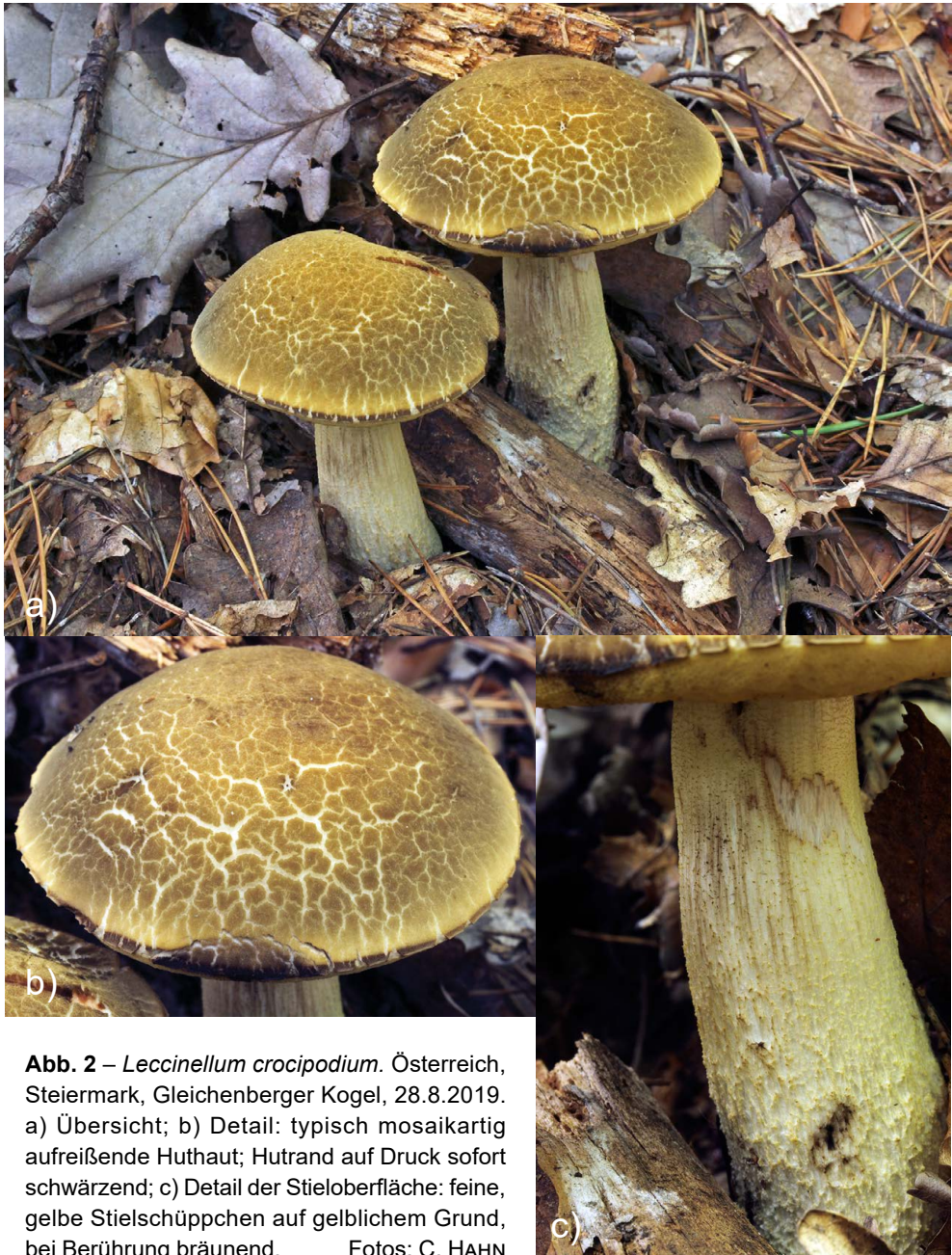
Abb. 2 – Leccinellum crocipodium. Österreich, Steiermark, Gleichenberger Kogel, 28.8.2019. a) Übersicht; b) Detail: typisch mosaikartig aufreißende Huthaut; Hutrand auf Druck sofort schwärzend; c) Detail der Stieloberfläche: feine, gelbe Stielschüppchen auf gelblichem Grund, bei Berührung bräunend.