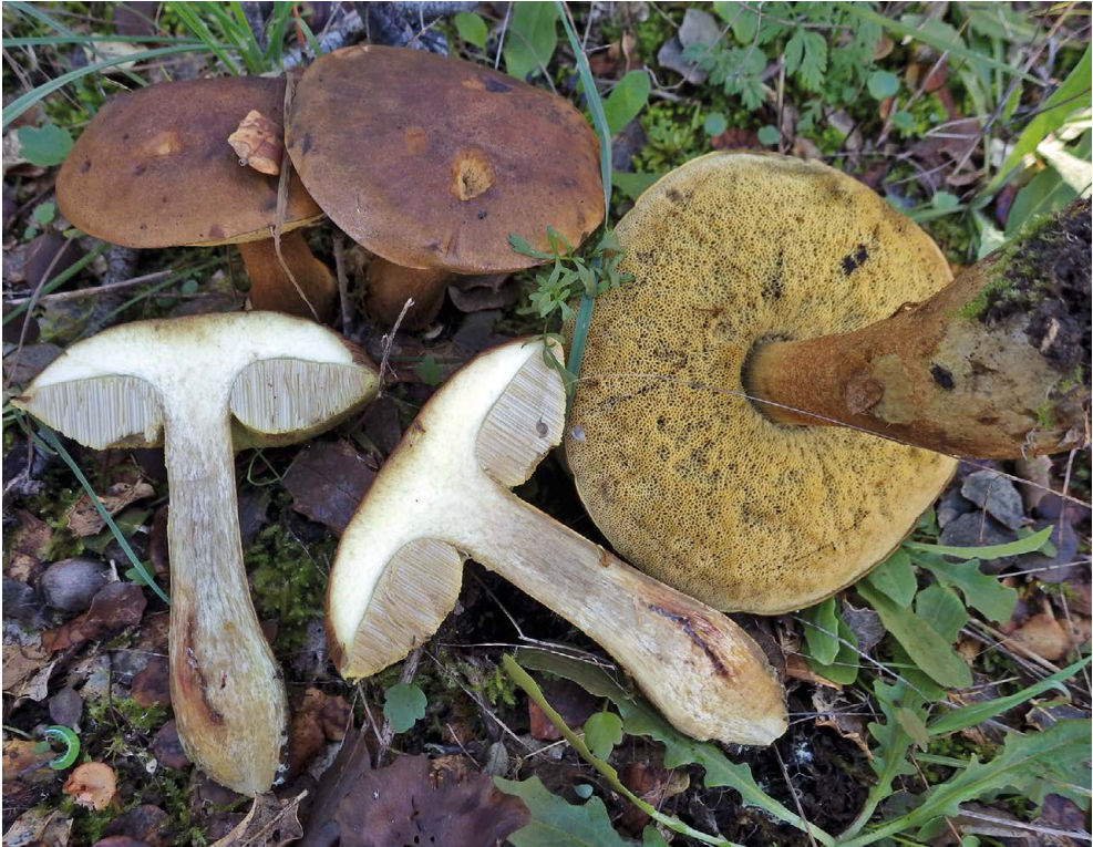
Abb. 8: Leccinellum tlemcenense. Portugal, Serra de São Mamede, Portugal, 9.12.2014. Röhren und Fleisch typisch blass.