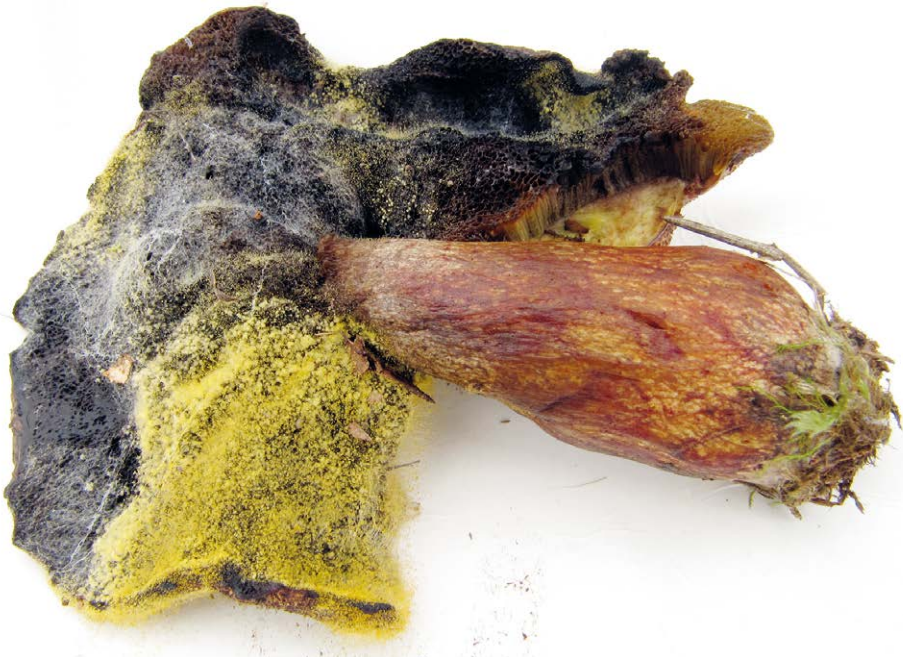
Abb. 1: Von Dicranophora fulva befallener Fruchtkörper mit von Sporangien und Sporangio- phoren bewachsenen, gelben sowie geschwärzten Bereichen des Hutes des Wirtes nach ein- einhalb-tägiger Lagerung.