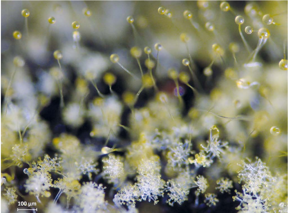
Abb. 3: Mikroskopische Aufnahme von Dicranophora fulva mit baumförmigen Sporangioophoren (unten) und langstieligen, kopfigen Sporangien (oben).

(VOGLMAYR et al. 1996). Zu den bekannten Substraten gehören u. a. Arten der Gattung Suillus Gray, Leccinum scabrum (Bull.) Gray, Paxillus involutus (Batsch) Fr. und Chroogomphus rutilus (Schaeff.) O.K. Mill. (VOGLMAYR et al. 1996). Die Zygosporen sind abgeflacht rundlich und hell bis dunkelbraun gefärbt (VOGLMAYR et al. 1996).