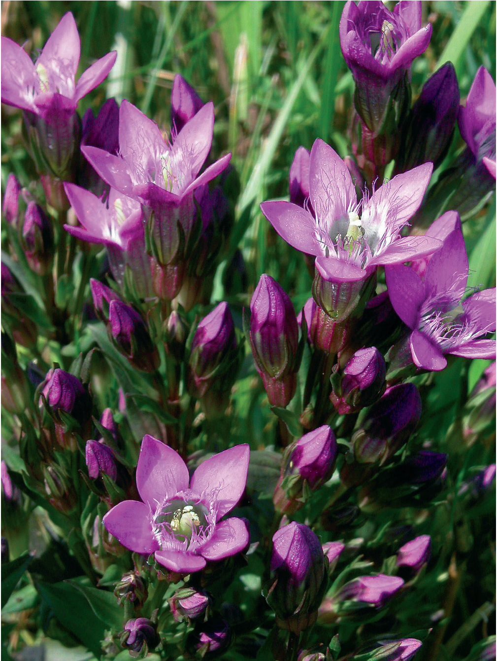
Abb. 1: Der Böhmisches Kranzenzian ( Gentianella bohemica ), Böhmerwald 2005.