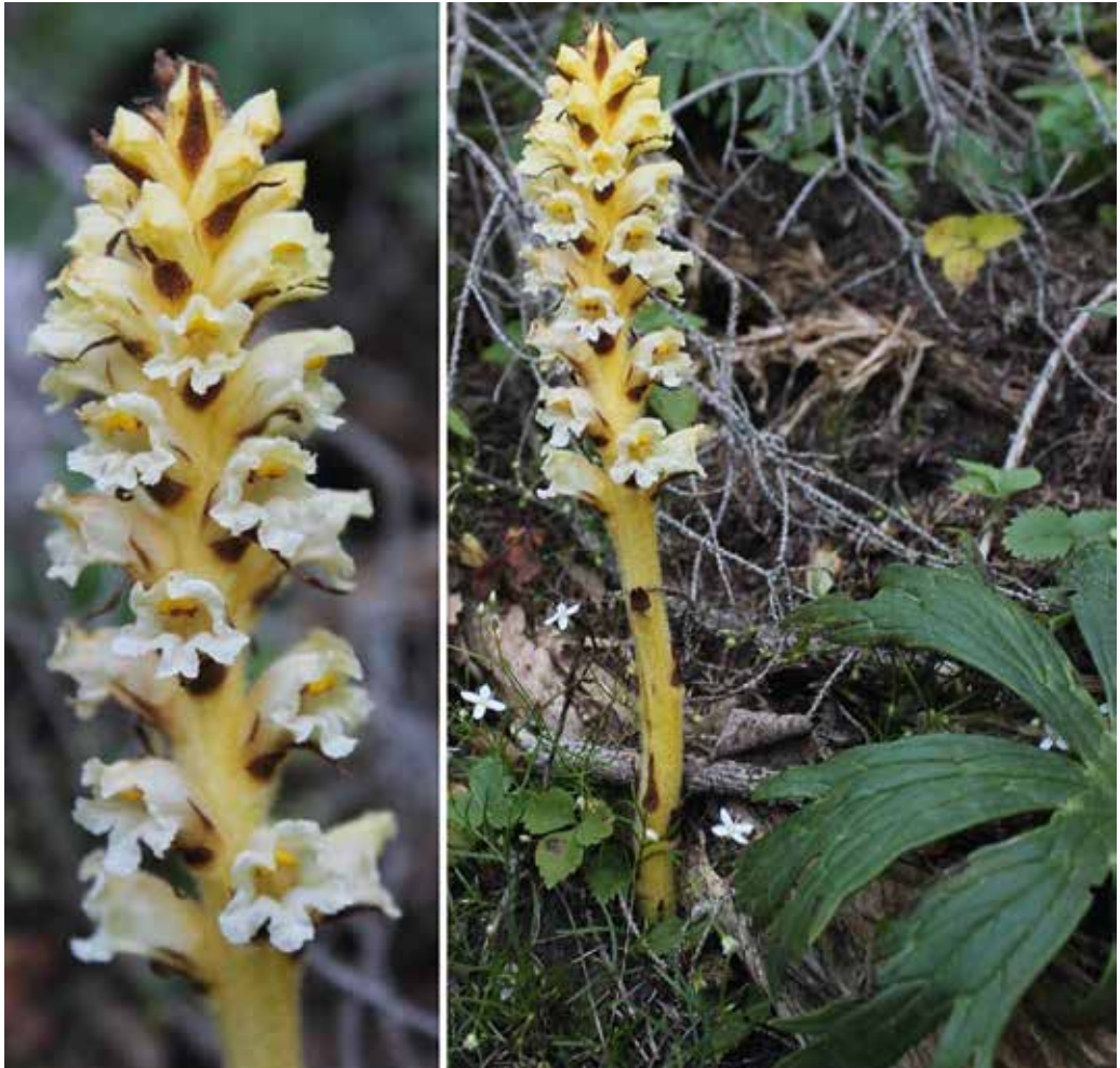
Abb. 1: Orobanche lycoctoni an der Straße zum Hochstadelhaus, im Kärntner Anteil der Lienzer Dolomiten. Im rechten Foto ist ein Blatt der Wirtspflanze ( Aconitum lycoctonum agg.) zu sehen. — Fig. 1: Orobanche lycoctoni along the forest road to the mountain hut Hochstadelhaus in the Carinthian part of the Lienzer Dolomiten mountain range. The picture to the right also shows a leaf of the host plant ( Aconitum lycoctonum agg.).

der Südalpen nahe und macht andererseits auch ein Vorkommen im benachbarten Teil Italiens möglich, von wo O. lycoctoni bisher nur aus den Julischen Alpen im unmittelbaren Grenzgebiet zu Slowenien bekannt ist; siehe Abb. 2. Der bemerkenswerteste der hier vorgestellten Funde ist aber zweifelsohne jener vom Grimming in den Nördlichen Kalkalpen der Steiermark, der jenseits des Alpenhauptkammes ca. 120 km nordöstlich der Kärntner Fundorte liegt. Wir gehen daher davon aus, dass die Zukunft etliche neue Funde dieser sicherlich insgesamt seltenen, stark disjunkt verbreiteten Art bringen wird.