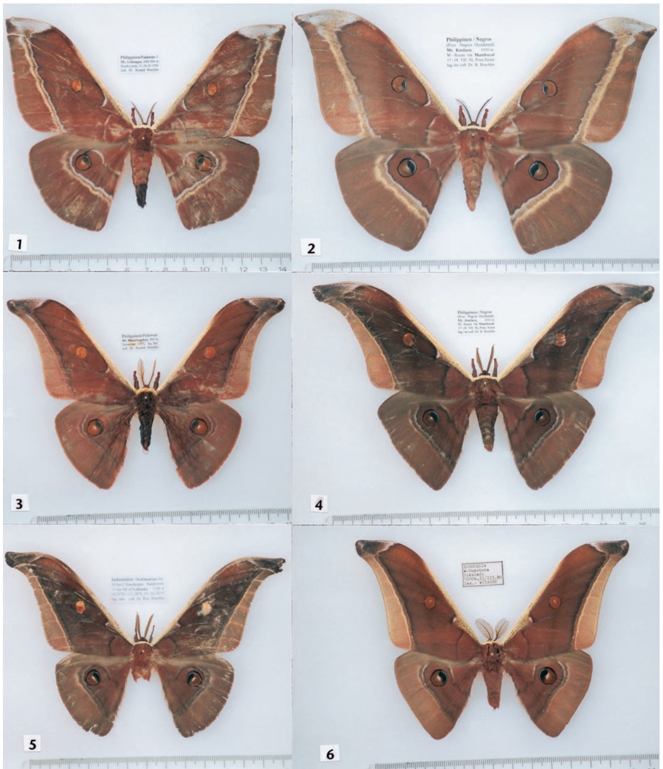
Farbtafel: Falter des Subgenus Antheraeopsis . Abb. 1: A. (Ao.) sahi ♀, Palawan, CRBP. Abb. 2: PT ♀ von A. (Ao.) paniki , Negros, CRBP. Abb. 3: PT ♂ von A. (Ao.) sahi , Palawan, CRBP. Abb. 4: PT ♂ von A. (Ao.) paniki , Negros, CRBP. Abb. 5: A. (Ao.) youngi ♂, Borneo, CRBP. Abb. 6: A. (Ao.) brunnea ♂, Sumatra, CRBP. — Maßstab in cm mit mm-Unterteilung.

im costalen Drittel gewellt. Dieses Merkmal weist kein bekannter ♀ Falter der anderen verglichenen Taxa auf. Deutlichstes Unterscheidungsmerkmal auf der Flügelunterseite ist neben der bei sahi hier ebenfalls orangefarbenen Vfl.-Ocelle (bräunlich bei paniki ) die Lage des