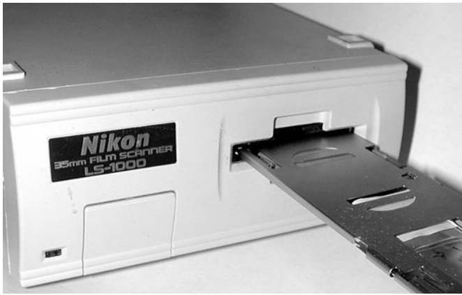
Abb. 3: Vorderansicht des LS 1000. Wichtig ist, das der Scanner über eine mechanische Höhenjustierung verfügt, damit das Präparat scharf gescannt werden kann.

Schwierigkeiten können bei besonders kleinen und transparenten Präparaten auftreten. Eine Fokussierung ist dann gelegentlich nicht möglich, jedoch sind die Scans ohne Fokussierung trotzdem oft brauchbar.