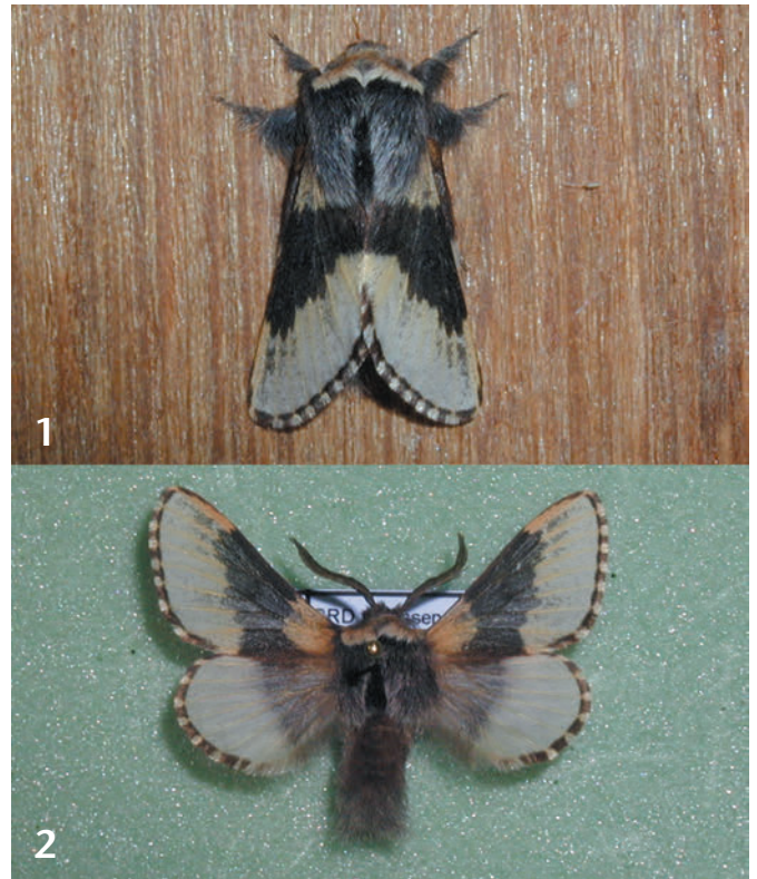
Abb. 1–2: Weißgezeichnetes aberratives ♂ von Poecilocampa populi . Abb. 1: Lebend sitzend am Fallendeckel. Abb. 2: Gespannt in der Sammlung.

GAEDIKE, R., & HEINICKE, W. (1999): Verzeichnis der Schmetterlinge Deutschlands. – Entomofauna Germanica 3; Dresden. Entomologische Nachrichten und Berichte, Beiheft 5, 216 S.