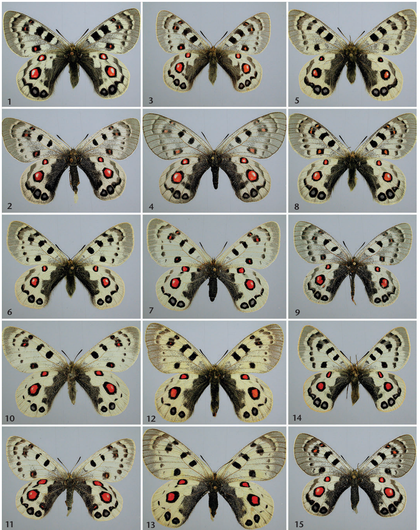
Abb. 1–30: Unterarten von Parnassius szechenyii FRIVALDSZKY, 1886. Abb. 1 (♂), 2 (♀): ssp. szechenyii , Qinghai, Kuku-Noor-Gebiet (Amdo), 15 km NW Zhongxia, 3700–4000 m, 1.–14. vii. 1985. Abb. 3 (♂), 4 (♀): ssp. szechenyii (= ssp. kansuensis ), Abb. 3 (♂): Kansu sept. occ., Hsining, Nanshan mont., Tatung, 3500 m, Juli [ohne Angabe des Jahres]; Abb. 4 (♀): Qinghai, Datong-Shan, Menyuan, 4000 m, 6. vii. 1989. Abb. 5 (♂), ssp. szechenyii (= ssp. luminosa ), China, Gansu, N. Qilianshan, Xian Shibi, 3300–3600 m, vii. 1988. Abb. 6 (♂), 7 (♀): ssp. szechenyii (Übergang zu ssp. evacaki ), China, Qinghai, Qinghai-Shan, Heimaha, 3400–3950 m, 30. vi. 1989. Abb. 8 (♂), 9 (♀): ssp. szechenyii (= ssp. junco ). Abb. 8 (♂): Heka, 3800 m, C. Qinghai, 25. vi.–3. vii. 1999. Abb. 9 (♀): China, Zentral-Qinghai, südl. Heka-Shan-Paß, 40 km südl. Heka, 3900–4100 m, 27. vii. 2002. Abb. 10 (♂), 11 (♀): ssp. frivaldszkyi . Abb. 10 (♂): China, Kanchowfu, Nordabhänge, Nashi-Paß, Mitte Juli [ohne Angabe des Jahres]. Abb. 11 (♀): Kansu sept, Pientaukou, Richthofen mont., 3500 m, Juli [ohne Angabe des Jahres]. Abb. 12 (♂), 13 (♀): Paratypen von ssp. evacaki , China, Qinghai, ca. 30 km nordwestlich Caka,