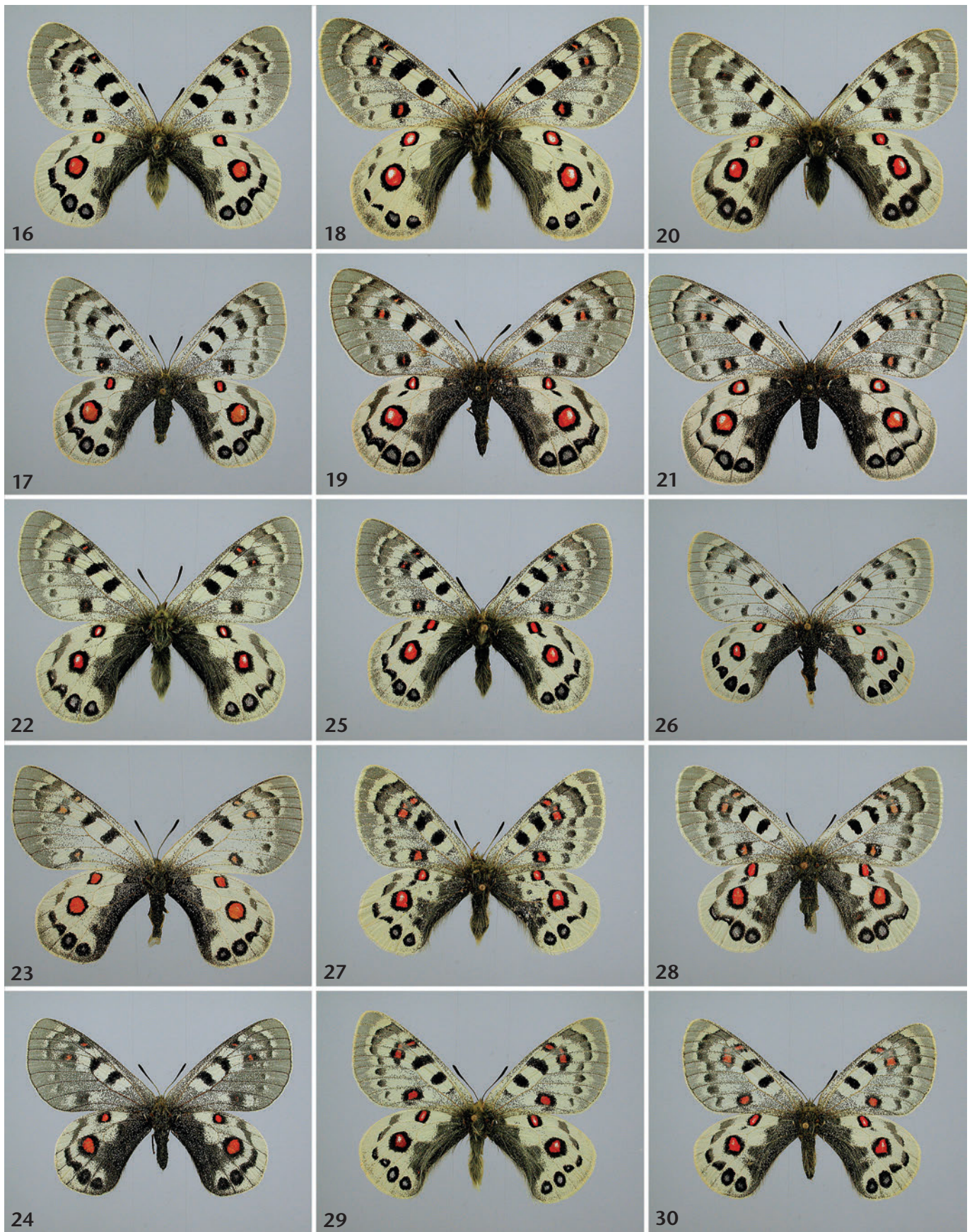
3500–4500 m, 6.–12. vii. 1991. Abb. 14 (♂), 15 (♀): ssp. lethe , China, Qinghai, Burchan-Buddha Mts., West Big Desert, 4000–4500 m, 29. vi.–21. vii. 1989. Abb. 16 (♂), 17 (♀): ssp. sadayukii , China, Qinghai, Central Amne Maqen Mts., Huashixia, 4700 m, 1.–15. vii. 1992. Abb. 18 (♂), 19 (♀): ssp. germanae , China, Kangting (Ta-tsieu-lou), Chetou-Shan, 3500–4000 m, Juni 1989. Abb. 20 (♂), 21 (♀): ssp. germanae (= ssp. fenzeli ). Abb. 20 (♂): China, Ost-Qinghai, Grenze Sichuan–Qinghai, westlich Linxia, 29. vi. 1993. Abb. 21 (♀): China, Süd-Gansu, Xiahe (Labuleng), 2900–3400 m, 30. vi.–4. vii. 1989. Abb. 22 (♂), 23 (♀), 24 (♀): ssp. germanae (= ssp. apicius ), China, Ost-Tibet, Qamdo, Dhamo-La, 4600 m, 24. vi. 1996. Abb. 25 (♂), 26 (♀): Paratypen von ssp. kassarovi , China, S. Tsinghai, Chiehku (= Yushu), 3800–4800 m, 9.–14. vii. 1998. Abb. 27 (♂), 28 (♀): ssp. ragaraja , China, Tibet, Chak-La, 5000 m, 60 km North of Lhasa, 22.–24. vi. 1994. Abb. 29 (♂), 30 (♀): ssp. ragaraya (= ssp. incognitus ), China, SC-Tibet, SW-Lhasa Pref., Kangtissu-Shan Mts., Nakaerh–Chushui, 4800–5200 m, 2.–5. vi. 1998. — Alle abgebildeten Falter befinden sich in coll. Rose.