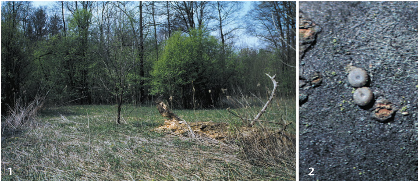
Abb. 1: Kleine Lichtung als Lebensraum des Pflaumenzipfelfalters ( Satyrium pruni ) im April in den Murauen bei Graz (Österreich). Abb. 2: Typisches Eigelege von Satyrium pruni an einem mehrere Zentimeter dicken Stamm der Traubenkirsche ( Prunus padus ).

dem Boden (Abb. 4). In 5 Gebieten wurden Eigelege im bodennahen Bereich am Stamm beobachtet. Stammablage betraf 73 % der Eifunde. Die restlichen Eier befanden sich an Astgabeln (18 %) und an Ästen (9 %). Bodennahe Bereiche am Stamm bis 30 cm Höhe über dem Boden (67 % aller Stammablagen) wurden bevorzugt. Überraschend war, daß nicht nur dünne Stämme, sondern auch häufig kräftige Stämme bis 10 cm (maximal bis 15 cm) Durchmesser belegt wurden. Hier befanden sich die Eier meist deutlich über 30 cm Höhe über dem Boden an feintrissiger Borke im Bereich vitaler oder abgestorbener Seitenäste.