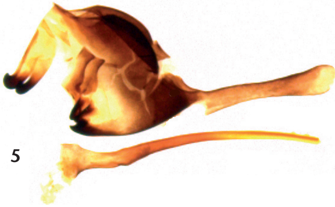
Abb. 5: L. sinapis , ♂, Genital mit Phallus (GP DEFR, Arbeitsnummer 2006/47), Fundort wie Abb. 1 (in coll. MOOSER).

gebirgshabitats mit flächigen Quercus - und Crataegus -Beständen. Da am Jebel Khasena um die Mittagszeit neben den beiden Belegstücken in kürzerer Zeit noch fünf weitere Exemplare gesichtet wurden, schien L. sinapis an diesem Fundort in einer intakten Population aufzutreten zu sein. Der Nachweis am Jbel Hammane war ein Zufallsfund auf der Durchreise Richtung Norden, so daß über mögliche weitere Tiere an dieser Lokalität keine Aussage gemacht werden kann. Das Belegexemplar wurde am frühen Nachmittag gesammelt.