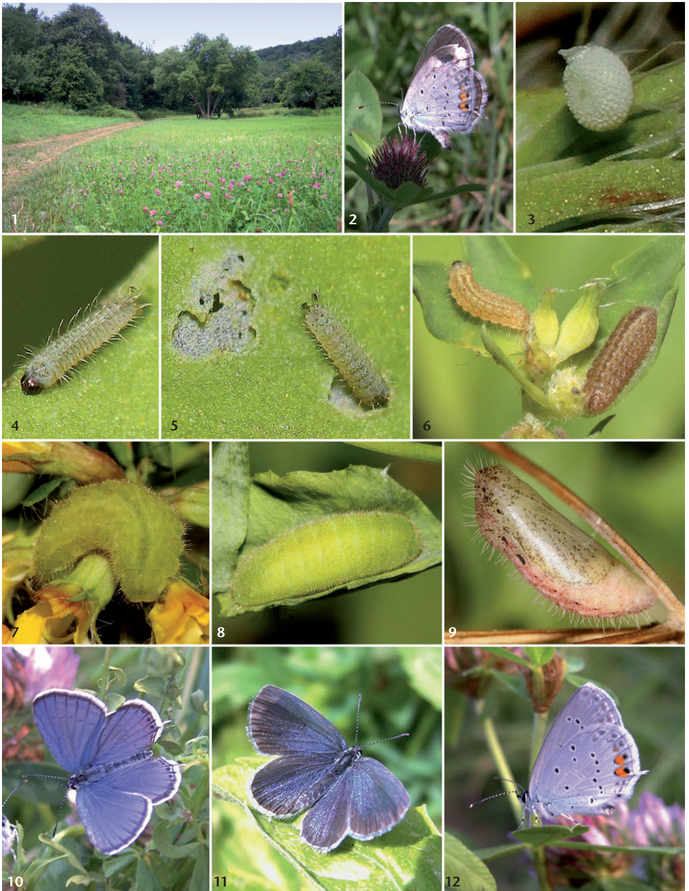
Abb. 1: Biotop von Cupido argiades in Bad Soden-Neuenhain, Im Süßen Gründchen, 14. vii. 2010. Abb. 2: Das dem Biotop (Abb. 1) entnommene, eierablegende Weibchen von Cupido argiades auf unaufgeblühtem Trifolium pratense , 14. vii. 2010. Abb. 3: Das Ei von Cupido argiades an Trifolium pratense , 10. viii. 2010. Abb. 4: Eiräupchen von Cupido argiades auf einem Trifolium pratense -Blättchen, 25. vii. 2010. Abb. 5: Fressendes Eiräupchen von Cupido argiades auf einem Trifolium pratense -Blättchen, 25. vii. 2010. Abb. 6: L 2 - und L 3 -Räupchen von Cupido argiades auf Lotus uliginosus , 27. vii. 2010. Abb. 7: Erwachsene Raupe aus der Zucht an Lotus uliginosus , 5. viii. 2010. Abb. 8: Präpuppe von Cupido argiades , 7. viii. 2010. Abb. 9: Puppe von Cupido argiades , 6. viii. 2010. Abb. 10: Frisch geschlüpftes ♂ aus der Zucht, 14. viii. 2010. Abb. 11: Weibchen aus der Zucht, 16. viii. 2010. Abb. 12: Frisch geschlüpftes Männchen aus der Zucht, 13. viii. 2010.