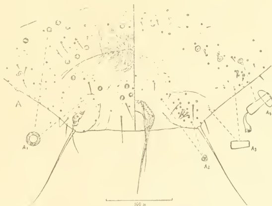
Abb. 2. A — Links ventrale, rechts dorsale Hälfte der hintersten Abdominalsegmente vom Holotypus von S. nanae . A 1 — Vielporige Scheibendrüse. A 2 — Dreiporige Scheibendrüse. A 3 — Flaschenförmige (tubulöse) Drüse. A 4 — Pilzförmige Drüse.

Dorsalseite: Mit 2 Paar nicht gut sichtbaren, von einzelnen dreisporigen Scheibendrüsen und Borsten umstellten Ostiolen. — Analring mit 6 etwa gleichlangen Borsten, einer etwas unregelmäßigen Innenreihe größerer verschieden geformter und einer Außenreihe kleinerer rundlicher „Zellen“. „Zellen“ der Außenreihe mit kleinem dornartigem Fortsatz. Analtube stärker sklerotisiert, gut sichtbar. — Dorsale Körperborsten kürzer als ventrale. Anzahl und Verteilung ähnlich wie auf der Bauchseite. — 3 Drüsentypen: 1. Dreiporige Scheibendrüsen. Auf allen Segmenten, wesentlich zahlreicher als auf der Ventralseite. 2. Flaschenförmige (tubulöse) Drüsen. Vereinzelt marginal und submarginal auf den hintersten Abdominalsegmenten. 3. Pilzförmige Drüsen. In größerer Anzahl auf der ganzen Dorsalseite mit Ausnahme