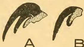
Abb. 1. Krallen A einer Vogellausfliege. B einer Säugetierlausfliege (nach Kemper aus Weidner).

wicklung erfolgt im Hinterleib des Weibchens, wobei das Nährmaterial für die Larve von paarig verästelten Drüsen des Uterus geliefert wird. Die Fliege legt eine vollentwickelte Larve ab, die sich unmittelbar darauf verpuppt, ein festes, fast kugeliges Tönnchen bildend. Der Hinterleib des Weibchens ist nach der Larvenablage stark zusammengeschrunpft. Mit dem Heranwachsen der nächsten Larve dehnt es sich dann allmählich wieder aus. Wegen dieser Fortpflanzungsweise werden die Lausfliegen zusammen mit den auf Fledermäusen parasitierenden Nyctiberiidae und den ebenfalls auf Fledermäusen parasitierenden, nur in den warmen und tropischen Gebieten lebenden Streblidae — nicht streng zutreffend — als Pupipara (Puppengebärer) bezeichnet.