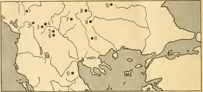
Abb. 1: Die Fundorte von Bombus lapponicus F. auf der südlichen Balkan-Halbinsel: 1 Tschakor-Paß (Jugoslawien); 2 Paschtrik (Albanien); 3—6 Titov-Vrh, Kobeliza, Pepelak und Begova (Jugoslawien); 7—11 Ossogowska-, Witoscha-, Rila-, Balkan-Planina und Alibotusch (Bulgarien); 12 Olymp (Griechenland).

2800 m Höhe je 1 ♀. Dies ist das bisher südlichste Vorkommen der Art in Europa (40° n. Br., in Italien 42° n. Br.).