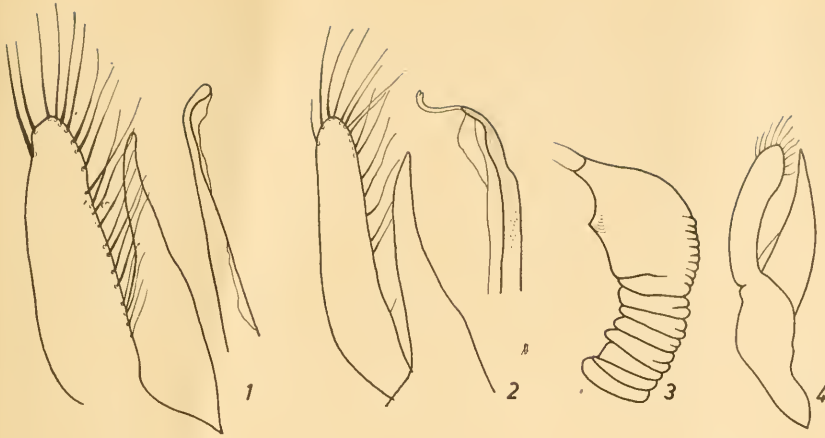
Abb. 1: Scymnus oertzeni Weise, Lectotypus. Aedoeagus mit Siphospitze. Abb. 2: Scymnus suturalis Thunb., Bayerischer Wald. Aedoeagus mit Siphospitze. Abb. 3: Scymnus limonii Donisth., Beveland. Receptaculum seminis. Abb. 4: Scymnus redtenbacheri Muls., Cadzand Z. Aedoeagus.

3. Die Scymnus-frontalis -Gruppe wird vom Autor in Zusammenarbeit mit den Herren Kreissl und Capra revidiert. Das Erscheinen dieser Studie ist noch für 1967 geplant. Die wichtigsten Änderungen lauten: