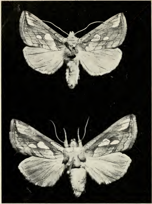
Abb. 1: Chryspidia putnami gracilis Lempke ♂, Südbayern, Au b. Bad Aibling, 450 m, E. Juni 1967, leg. J. Wolfsberger.