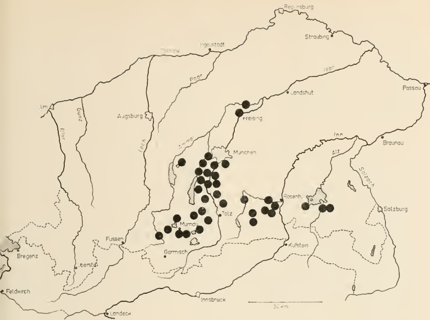
Karte 1: Verbreitung von Chr. putnami gracilis Lempke in Südbayern