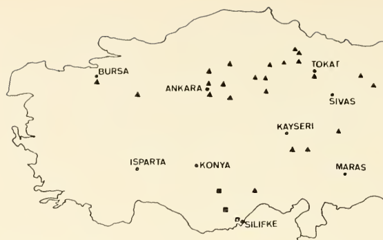
Abb. 3 Verbreitungskarte (▲) D. cinerarium F. (■) D. paracinerarium Breun.

D. cinerarium ist äußerst variabel, was in 22 benannten morphae zum Ausdruck kommt. Besonders artcharakteristisch sind die prägnanten weiblichen Formen, die unter den meisten mir bekannten Populationen neben der typischen Form auftreten. Lediglich der Habitus, speziell die Halsschildform, bleibt unter den männlichen Tieren weitgehend konstant. Auch die Belege des paracinerarium von Karaman-Sertavulpaß-Silifke weisen die für cinerarium charakteristischen Formen auf. Insbesondere finden sich darunter fast alle beschriebenen, weiblichen cinerarium -Varietäten, wie z. B. perroudi Pic, subobesum Pic, cinerarium F. s. s. oder die männlichen Formen micans Thoms., densevestitum Breun. u. A. So ist paracinerarium weder im Habitus noch in der Zeichnung von der Formenfülle des cinerarium zu unterscheiden und muß als artgleich mit cinerarium betrachtet werden.