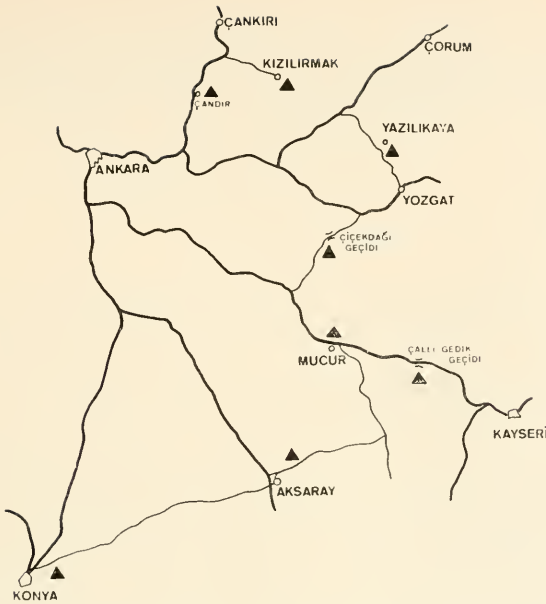
Abb. 2 Verbreitungskarte des Dorcadion iconiense Dan. (▲)

demnach über ganz Zentralanatolien verbreitet (Verbreitungskarte Abb. 2). Die Unterschiede der nördlicheren Populationen zur Gesamtvariationsbreite der Stammform des iconiense sind so gering, daß der Form muchei kein subspezifischer Rang zuerkannt werden kann.