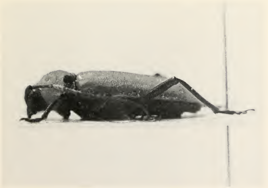
Abb. 2: Purpuricenus creticus sp. nov. a) Vorderansicht, b) Seitenansicht