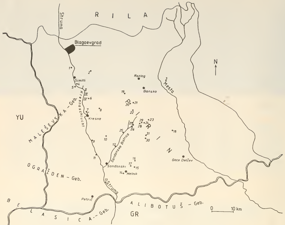
Abb. 1: Lage der Psychidenfundorte in Bulgarisch-Mazedonien. 1 Železnica, 2 Gradevo, 3 Elešnica, 4 Černiče, 5 Krupnik, 6 Stara Kresna, 7 Gara Pirin, 8 Vlachi, 9 Strumjani, 10 Ploski, 11 Valkovo, 12 Liljanovo, 13 Vulkanhügel Kožuch, 14 Lozenica, 15 Rožen, 16 Sugarevo, 17 Karlanovo, 18 Breznica. Fundorte im Piringebirge: 19 Javorov-Hütte, 20 Vichren (2914 m ü. NN), 21 Banderica-Hütte, 22 Todorina porta, 23 Popovo-See, 24 Kamenica (2822 m ü. NN), 25 Tremošnica, 26 Jane Sandanski, 27 Popina laka, 28 Begovica-Hütte, 29 Pobit kamak-Tal, 30 Pirin-Hütte, 31 Čemerika-Tal.

Gebirges ist von NNW nach SSE gerichtet. Das südwestliche Vorland ist charakterisiert durch Xerothermstandorte, vornehmlich auf jungtertiären Bildungen und hat im mittleren Strumatal im Grenzbereich zu Griechenland seine tiefste Lage.