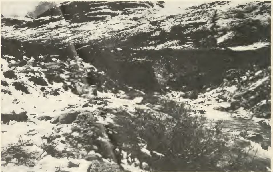
Abb. 2. Heutal, 2200 m, 9. Juni 1989. Südexponierte Blockhalde mit Buschweidenbestand, ein Lebensraum des Glasflüglers Synanthedon polaris , zum Zeitpunkt der Schneesmelze.