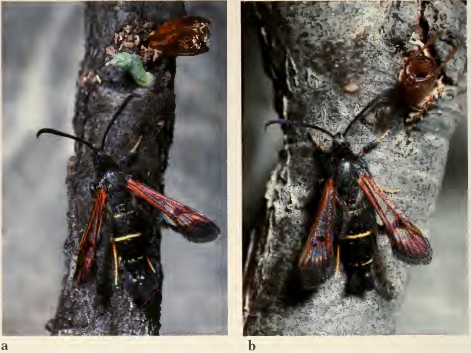
Abb. 3. Frischgeschlüpftes Männchen (a) und Weibchen (b) der Heutal-Population von Synanthedon polaris . Oben im Bild ist noch jeweils die leere Puppenhülle erkennbar. Laboraufnahmen, 23. Juni 1989.