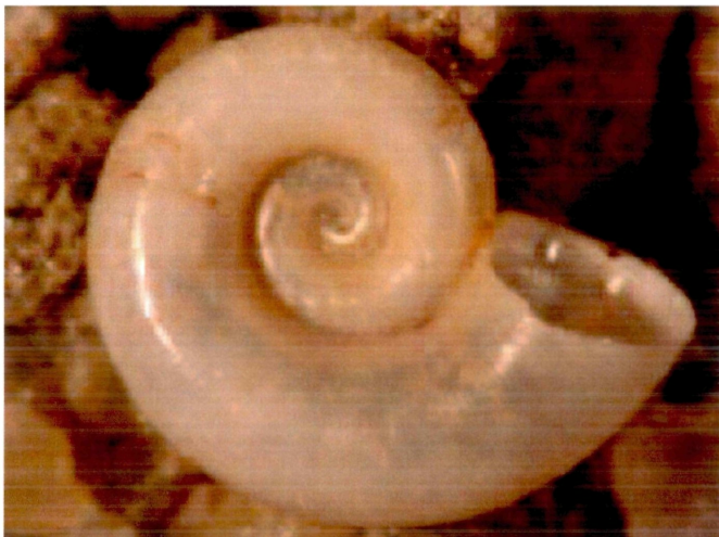
Abb. a,b,c: Hauffenia edlingeri nov. spec., Paratypus.