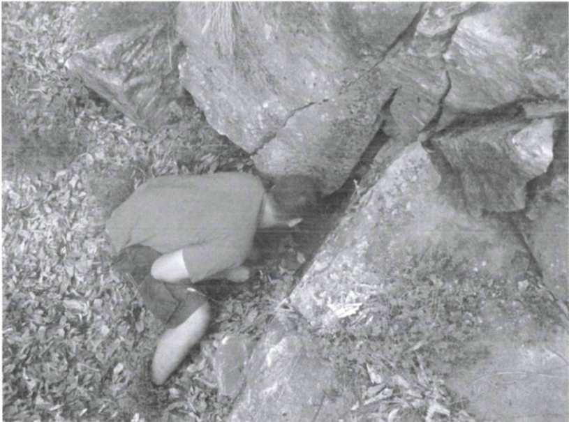
Abb. 1 (links): Balcanodiscus stummerorum nov. spec. von 7 km oberhalb des Klosters Ypapantis to Christo, Pangäon-Gebirge. Abb. 2 (rechts): Der Locus typicus von Balcanodiscus stummerorum nov. spec. 7 km oberhalb des Klosters Ypapantis to Christo, Pangäon-Gebirge.