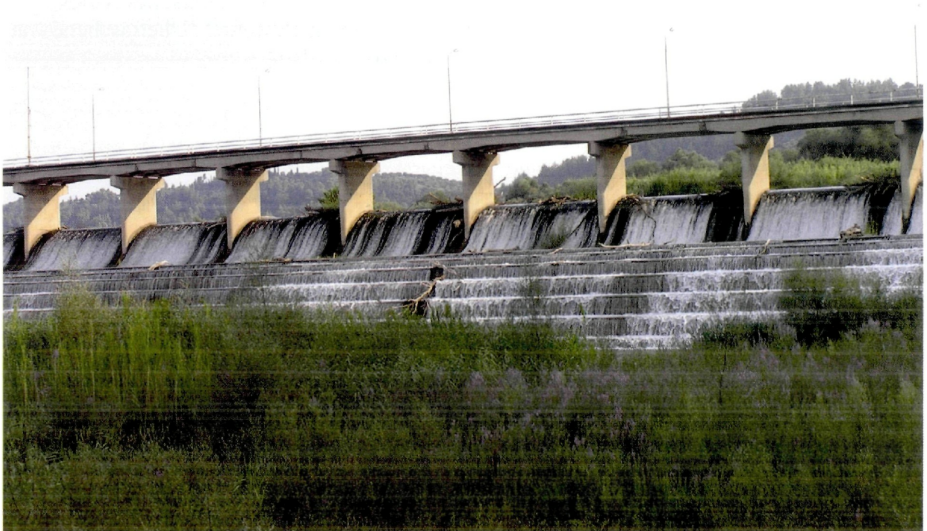
Abb.2: Fundort des Genistes am Alpeos-Staudamm.

REISCHÜTZ A. & P. L. REISCHÜTZ (2004): Helleniká pantoía, 8: Olympische Idylle – Neue Hydrobiiden (Gastropoda: Prosobranchia: Hydrobiidae) und einige andere seltene Arten aus dem Genist des Alfios bei Olimbia (Iliá, Peloponnes, Griechenland).- Nachr.bl. erste Vorarlb. Malak. Ges. 12:3-4, Rankweil.