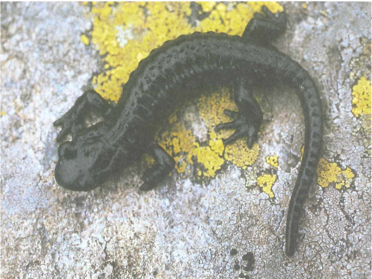
Abb. 5: Alpensalamander ( Salamandra atra ), SE-Hang des Salzkofels (2150 m); man beachte den Fingerstummel an der linken Hand