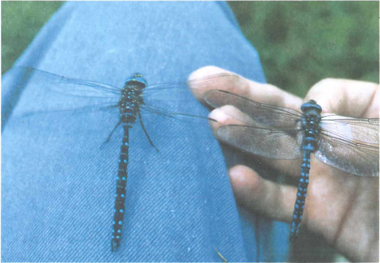
Abb. 7: Aeshna juncea (links) und Aeshna caerulea (Seewiesenried)