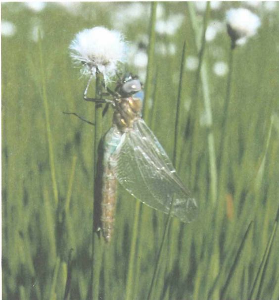
Abb. 3: Somatochlora alpestris kurz nach Schlupf an einem Wollgrasstengel; in der Plattach (2150 m)