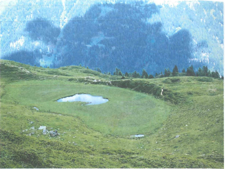
Abb. 4: Carex-Eriophorum -Ried mit zentralem See (Seewiesenalm, 1980 m); hier fliegen Aeshna juncea , Aeshna caerulea , Somatochlora alpestris und Coenagrion puella ; Laichplatz des Bergmolches ( Triturus alpestris )