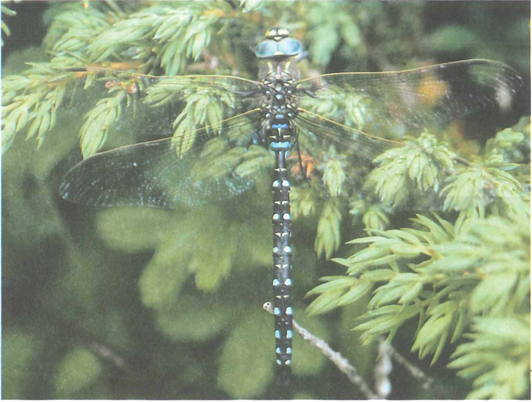
Abb. 6: Aeshna juncea , SE-Hang des Salzkofels (2100 m)