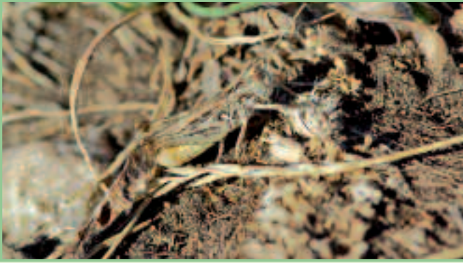
Der vom Aussterben bedrohte Felsgrashüpfer am Hackelsberg