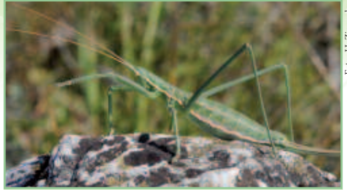
Die eindrucksvolle Sägeschrecke wurde nach längerer Zeit 2012 erstmals wieder am Zeilerberg nachgewiesen.

breitet auftretende vegetationsarme Zickstellen. Verbreitete Charakterarten sind dabei die Breitstirnige Plumpschrecke, die Kurzflügelige Schwertschrecke und die Grüne Strandschrecke. Bemerkenswert ist auch das Vorkommen aller sieben im Nordburgenland vorkommenden Grillenarten.