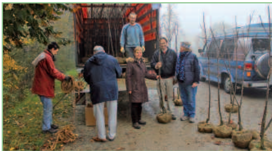
Beginn der Edelkastanienausgabe in Forchtenstein am 3. November 2012.

Im Rahmen unseres Edelkastanien-LEADER-Projektes fand am 3. November 2012 die dritte und letzte Pflanzaktion statt.