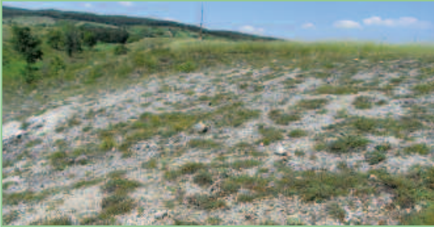
Felstrockenrasen in der Thenau bei Breitenbrunn – ein IGA mit Vorkommen des Felsgrashüpfers.

Als einzige der Raritäten des Neusiedlersee-Gebiets profitiert diese Art nicht von der Ausdehnung der Weideflächen, sondern benötigt höchstens extensiv genutzte Übergangsbereiche zwischen schütterem Schilf und offenem Boden auf stark salzigen oder schottrigen Standorten.