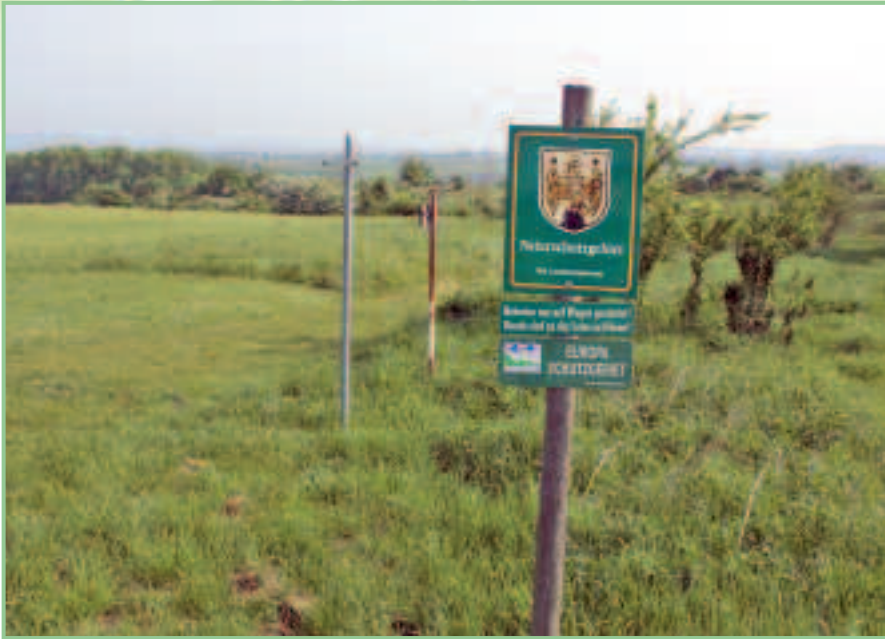
Tafel vor einem Naturschutzgebiet: Könnte man im kleinen Burgenland Schutzgebiete schaffen, die man samt Flora und Fauna einfach in Ruhe lassen müsste?