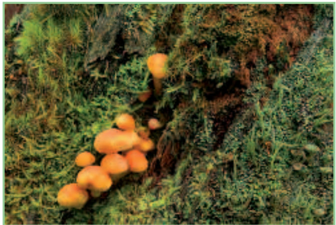
Franz Wippel, „Pilze am Baumstumpf“

Am 10. November 2012 fand die Siegerehrung und Ausstellungseröffnung des vom „Verband Österreichischer Amateurfotografenvereine (VÖAV)“, der Esterhazy-Privatstiftung Lackenbach und dem Naturschutzbund Burgenland organisierten 4. Natur-Fotowettbewerbes statt.