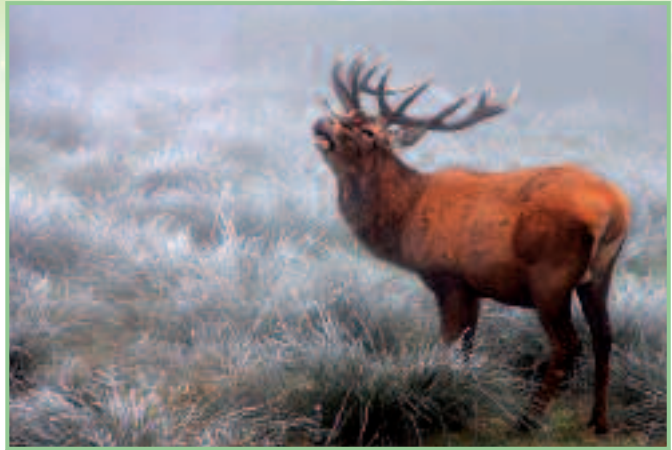
Rene Van Echelpoel, „Rothirsch im Nebel“

Siegerehrung und Ausstellung der besten Bilder auf Schloss Lackenbach