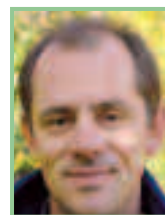
Text und Fotos: Mag. Manfred Fiala, Bezirksgruppenleiter Oberpullendorf des Naturschutzbundes Burgenland

Gemäß den Förderbedingungen werden alle drei Waldparzellen sich selbst überlassen (es gilt Prozessschutz), wobei beim Wald in Lindgraben vereinzelt forstliche Eingriffe unumgänglich sein werden.