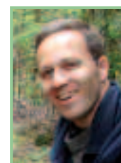
Autor und Foto: Dr. Georg Wolfram (Geschäftsführer der DWS Hydro- Ökologie GmbH)