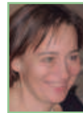
Projektleitung, Text und Fotos: Mag. Renate Roth, Bezirksgruppen- leiterin Mattersburg des Naturschutz- bundes Burgenland

Kleinstbiotope zu erhalten. Ein zusätzlicher Anreiz für die Kopfbaumpflege ist die landesweite Durchführung von Korbflechtkursen. Eine Renaissance der Flechtkunst gewährleistet einerseits das Wiederaufleben eines alten, aussterbenden Handwerks, vor allem aber ergibt sich aus erhöhter Korbflechtaktivität eine gesteigerte Nachfrage an dünnen Weidenruten, die nur dann gewonnen werden können, wenn Kopfbäume entsprechend gepflegt werden.