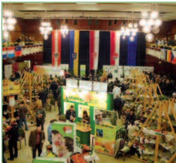
Blick in die Babenbergerhalle

Die internationale Obstausstellung Europom fand zwischen 26. und 28. Oktober 2012 erstmalig in Österreich in Klosterneuburg (NÖ) statt.