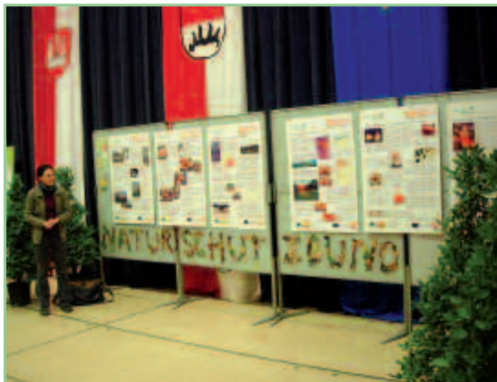
Verena Pilz mit der Streuobstausstellung des ÖNB Burgenland

Rund 5.000 Besucher stürmten die Obsterlebniswelt und konnten mehr als 1.000 Obstsorten aus 14 europäischen Ländern sehen und riechen, 40 alte Apfelsorten konnten verkostet und gekauft werden, wovon reichlich Gebrauch gemacht wurde.