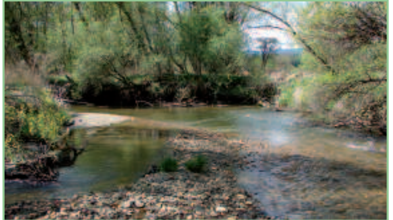
Die Lafnitz Höhe Kitzladen: ein hoch dynamischer Fluss - dem nur die Fische fehlen.

Die Lafnitz zwischen Neustift und Allhau bietet einen guten Anhaltspunkt für einen Langzeitvergleich des Fischbestands. Hier wurden bereits Anfang der 1990er Jahre quantitative