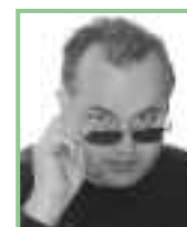
Text und Fotos: Dr. Josef Fally, Mitarbeiter des Naturschutzbundes Burgenland