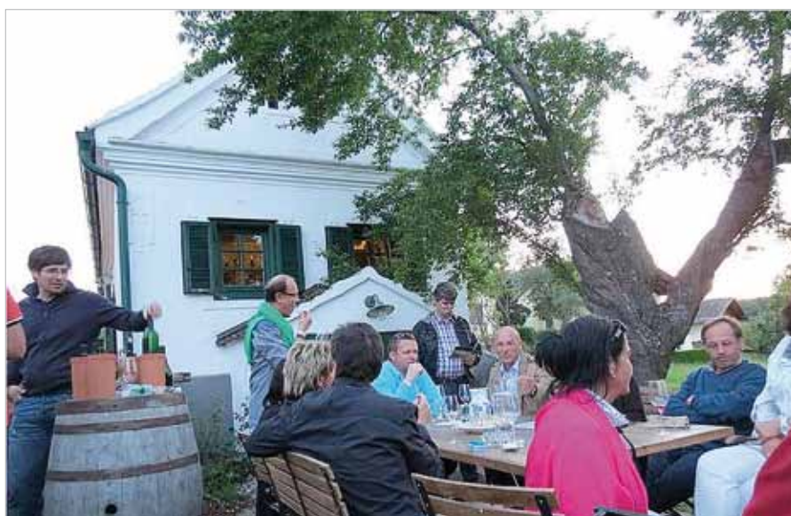
■ Weinfrühling im Südburgenland