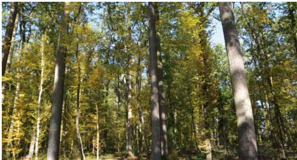
■ oben: Eichenwertholzbestand

Das Burgenland wäre ohne menschliches Einwirken eigentlich