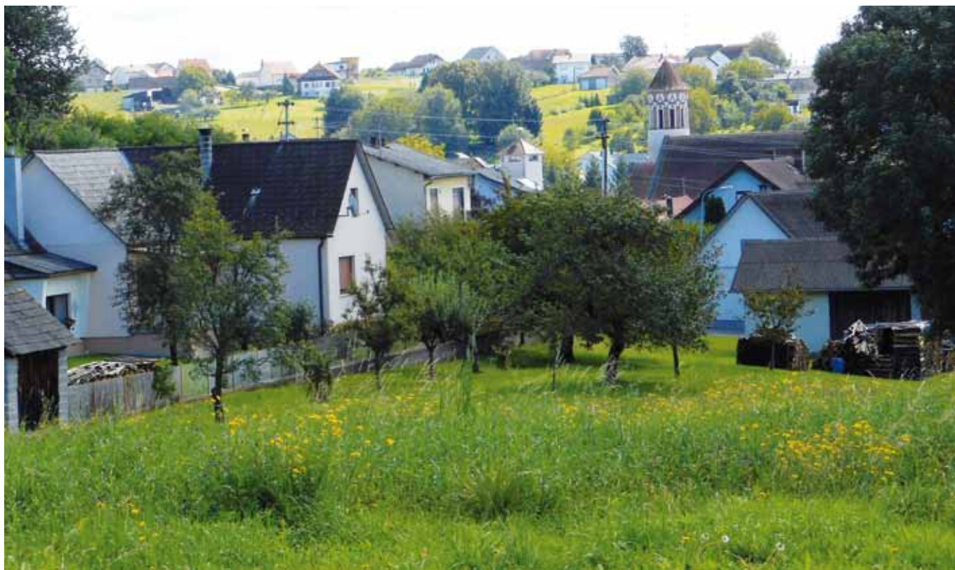
■ Hausgärten im Hintaus bilden den sanften Übergang vom Dorf zur umgebenden Landschaft (Güttenbach)

Auf Grund der zunehmenden Veränderung bzw. Zerstörung ursprünglicher Lebensräume sind immer mehr Tier- und Pflanzenarten auf Restlebensräume in Siedlung(nah)bereichen zurückgedrängt. Die Siedlungsökologie als Disziplin der Biologie untersucht u. a. die Flora und Fauna in menschlichen Siedlungsräumen. Im vom Fachverband der Schwei-