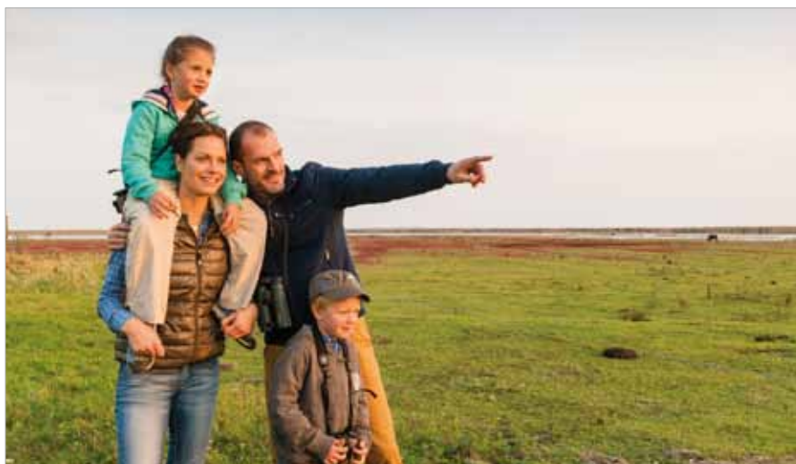
■ Familien werden von der Saison-Auftaktveranstaltung, den Pannonischen Natur.Erlebnis.Tagen, besonders angesprochen