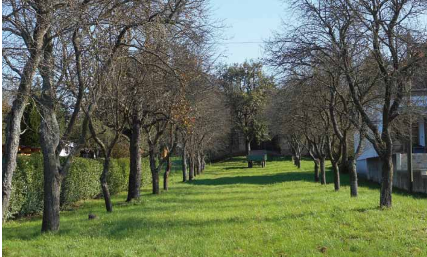
■ Typisches südburgenländisches Hintaus mit Streuobstwiesen (Kleinpetersdorf)

zer Raumplanerinnen und -planer (2003) herausgegebenen Handbuch Siedlungsökologie heißt es: „Mit den Mitteln der Raumplanung sollen vorausschauend die Weichen zugunsten der Natur im Siedlungsraum gestellt werden. Das Ziel ist die langfristige Sicherung von Freiräumen und Strukturen für eine ökologische Siedlungsentwicklung und den Lebensraumverbund. ... Der Siedlungsökologie ist in der Ortsplanung und generell in der planerischen Interessensabwägung daher mehr Gewicht zu verleihen. ... Der Problematik der inneren Verdichtung (Verdrängung wertvoller Strukturen) sowie der ökologisch wenig qualitätsvollen Siedlungserweiterungen kann innerhalb des Siedlungsgebiets mit Kompensationsmaßnahmen begegnet werden (ökologischer Ausgleich). Beispielsweise macht die Schaffung von Trittsteingebieten (Natur-oasen in unbebauten Parzellen) auch im Siedlungsgebiet Sinn.“