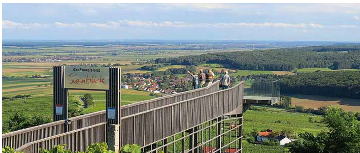
■ Der Weinblick – eine touristische Attraktion im südburgenländischen ökoEnergieLand

Aus den Erfahrungen im Energieeffizienzbereich im öffentlichen Sektor lassen sich noch weitere Potentiale zur Effizienzsteigerung und Energieeinsparung vermuten. Daher werden in der Weiterführung bestimmte Bereiche näher