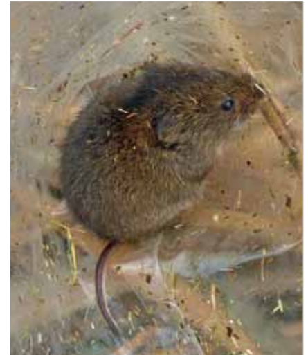
■ Gefangene Sumpfwühlmaus