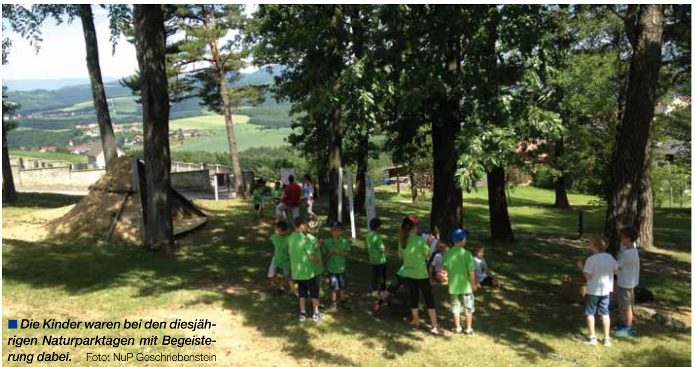
■ Die Kinder waren bei den diesjährigen Naturparktagen mit Begeisterung dabei.

Naturpark-Informationsbüro A-7471 Rechnitz Bahnhofstraße 2a Telefon +43 (0) 3363 79143 Mobil +43 (0) 664 4026851 naturpark@rechnitz.at www.naturpark-geschriebenstein.at