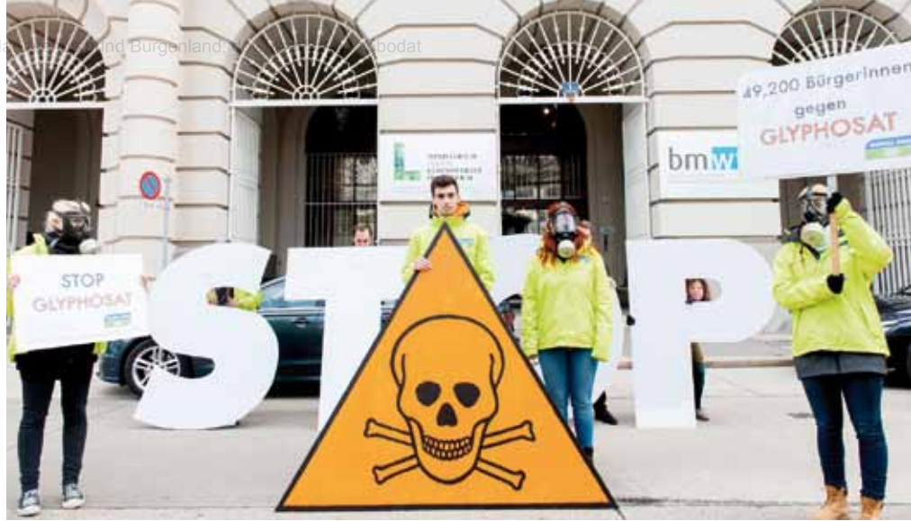
■ Aktivistinnen und Aktivisten von GLOBAL 2000 protestierten bereits im Vorjahr gegen die Wiedezulassung von Glyphosat

► Bei künftigen Zulassungsverfahren dürfen nur noch solche Einzelwirkstoffe und Präparate als