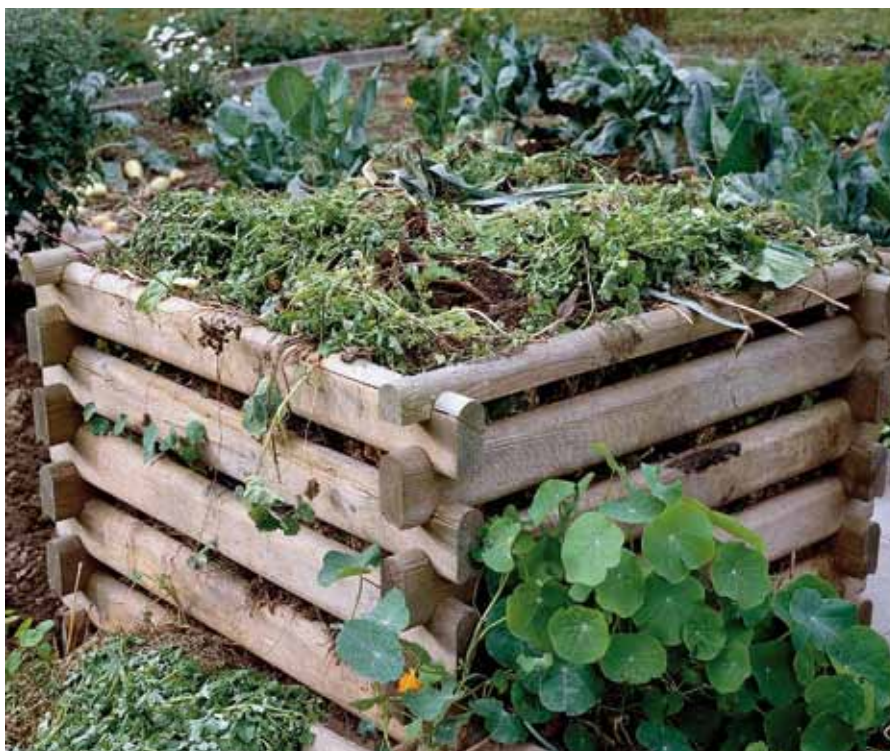
■ Ein vorbildlich angelegter Komposthaufen ...

Zur Kompostierung eignen sich grundsätzlich alle verrottbaren pflanzlichen und tierischen Abfälle, z. B. Gemüse-, Obst- und Speisereste, Kaffee- bzw. Teesackerl und Eierschalen sowie Abfälle aus dem Garten, wie Laub-, Grasschnitt, Stroh, Baum- und Heckenschnitt. Diese Materialien sollten gut durchmischt und schichtweise aufgesetzt werden. Der ideale Standort für einen Komposthaufen ist ein halbschattiger Platz, wobei der Haufen auf natürlichem Boden aufgesetzt werden sollte.