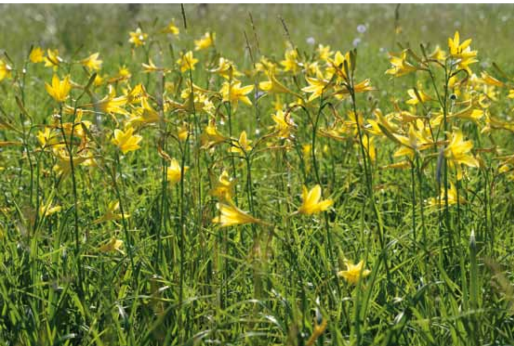
■ GELBE TAGLILIE ( Hemerocallis lilioasphodelus ) in den Eberhard Stüber-Wiesen in Neustift bei Güssing