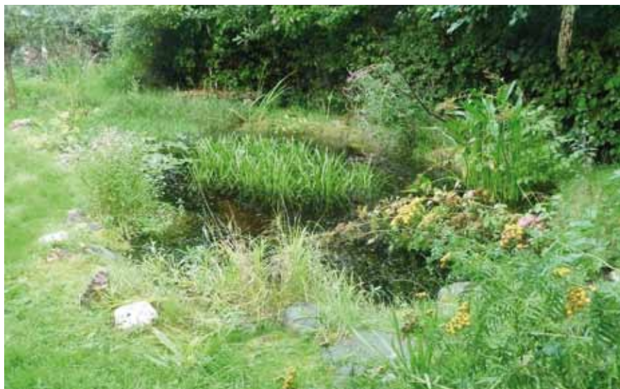
■ Ein schöner, naturnaher Garten kommt ohne jegliches Gift aus.

https://landwirtschaft.greenpeace.at/glyphosat-eci/