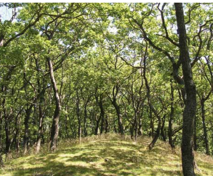
■ Naturwaldreservat Lange Leitn, Neckenmarkt