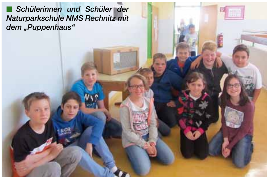
■ Schülerinnen und Schüler der Naturparkschule NMS Rechnitz mit dem „Puppenhaus“

den starren Puppen schlüpfen die ersten Schmetterlinge, die in die Freiheit entlassen wurden.