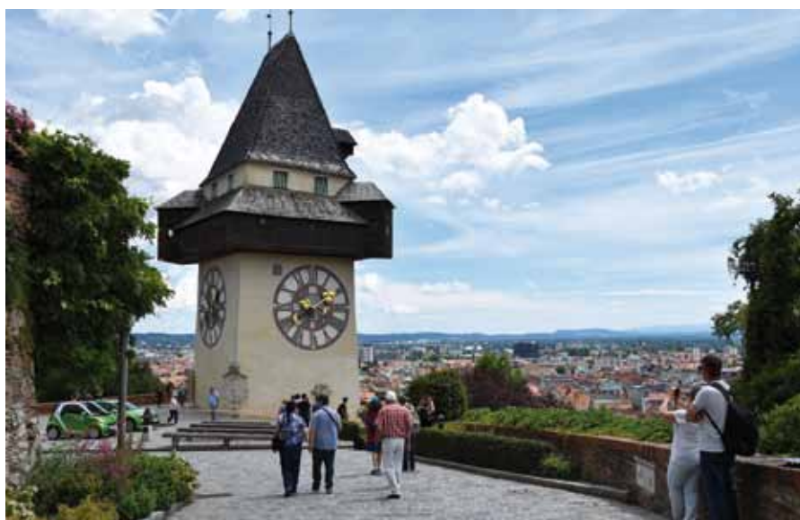
■ Wahrzeichen von Graz: der Uhrturm

Danach ging es in die Grazer Altstadt, die sich bei angenehmem Frühsommerwetter von ihrer schönsten Seite zeigte. Die vielen kleinen, versteckten Plätze und Plätzchen mit ihren zahllosen gemütlichen Lokalen präsentierten sich in südlichem, fast mediterranem Charme. Ein Muss war der Grazer Dom mit dem Mausoleum Kaiser Ferdinands II. und natürlich der Schlossberg mit seinen herrlichen Ausblicken auf die