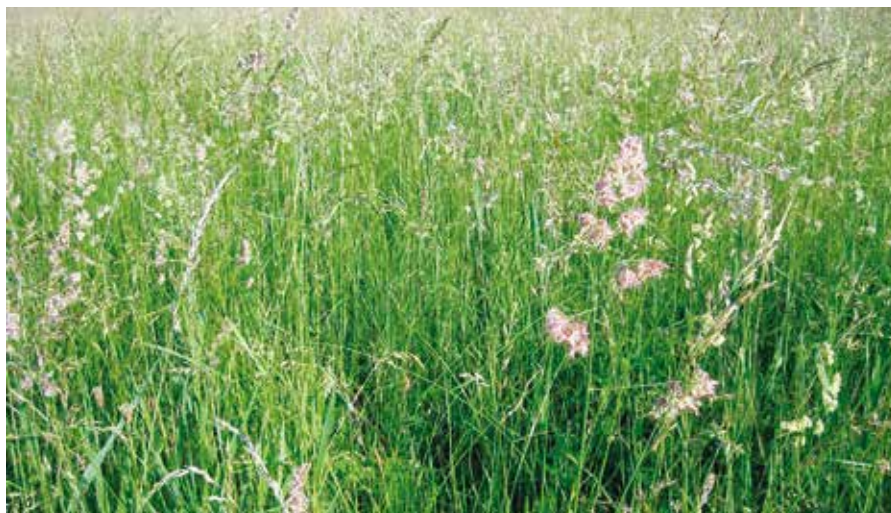
■ Von Gräsern dominierte Auwiese Anfang Juni

Eine sehr späte Mahd, nach Mitte Juni, sollte hingegen tunlichst nur den Halbtrockenrasen vorbehalten bleiben. Nur wenige der einmähdigen, sehr spät im Sommer gemähten Wiesen und nur solche auf den absolut kargen Trockenstandorten beherbergen