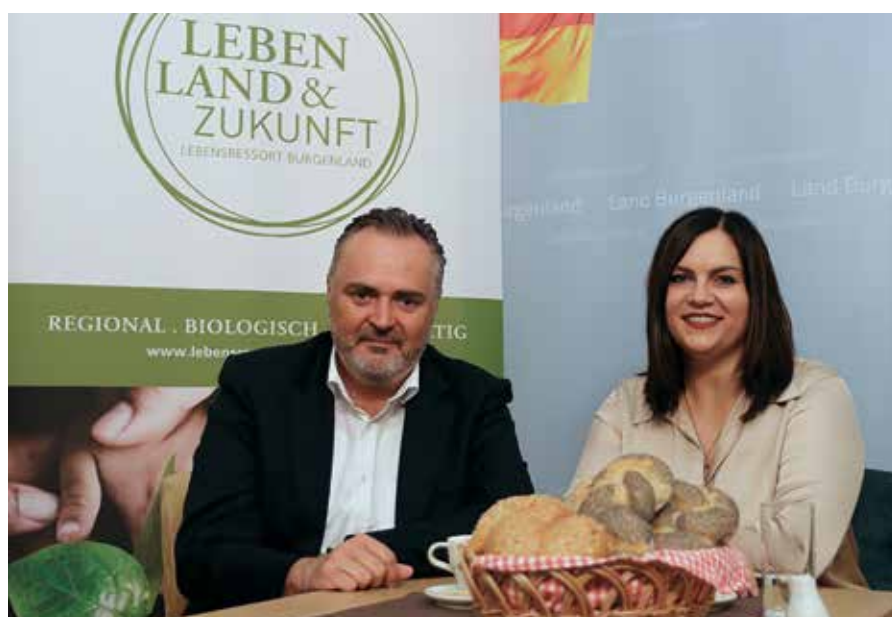
■ LH Hans Peter Doskozil und LR in Astrid Eisenkopf präsentieren Bio-Wende

12. Durch wissenschaftliche Begleitung Fehler vermeiden. FiBL, das Forschungsinstitut für biologischen Landbau, wird ab Juni 2019 alle Maßnahmen wissenschaftlich begleiten. Eine Machbarkeitsstudie zu 100 % Bio im Burgenland soll neue Wege aufzeigen. ♦