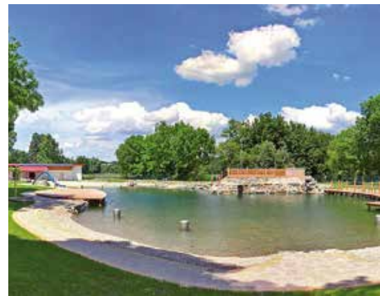
■ von oben nach unten: Naturbadesee Kobersdorf, Erlebnisbad Kaisersdorf, Naturbadesee Markt St. Martin