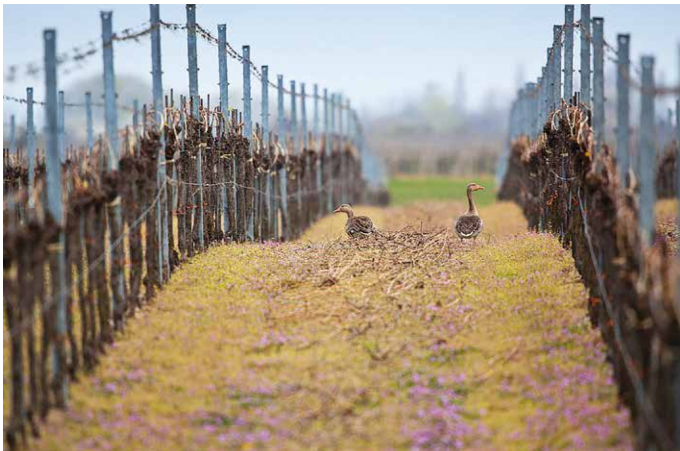
■ Entlang des Grünen Bands konnten sich in ganz Europa bedrohte Arten – Pflanzen und Tiere – halten.