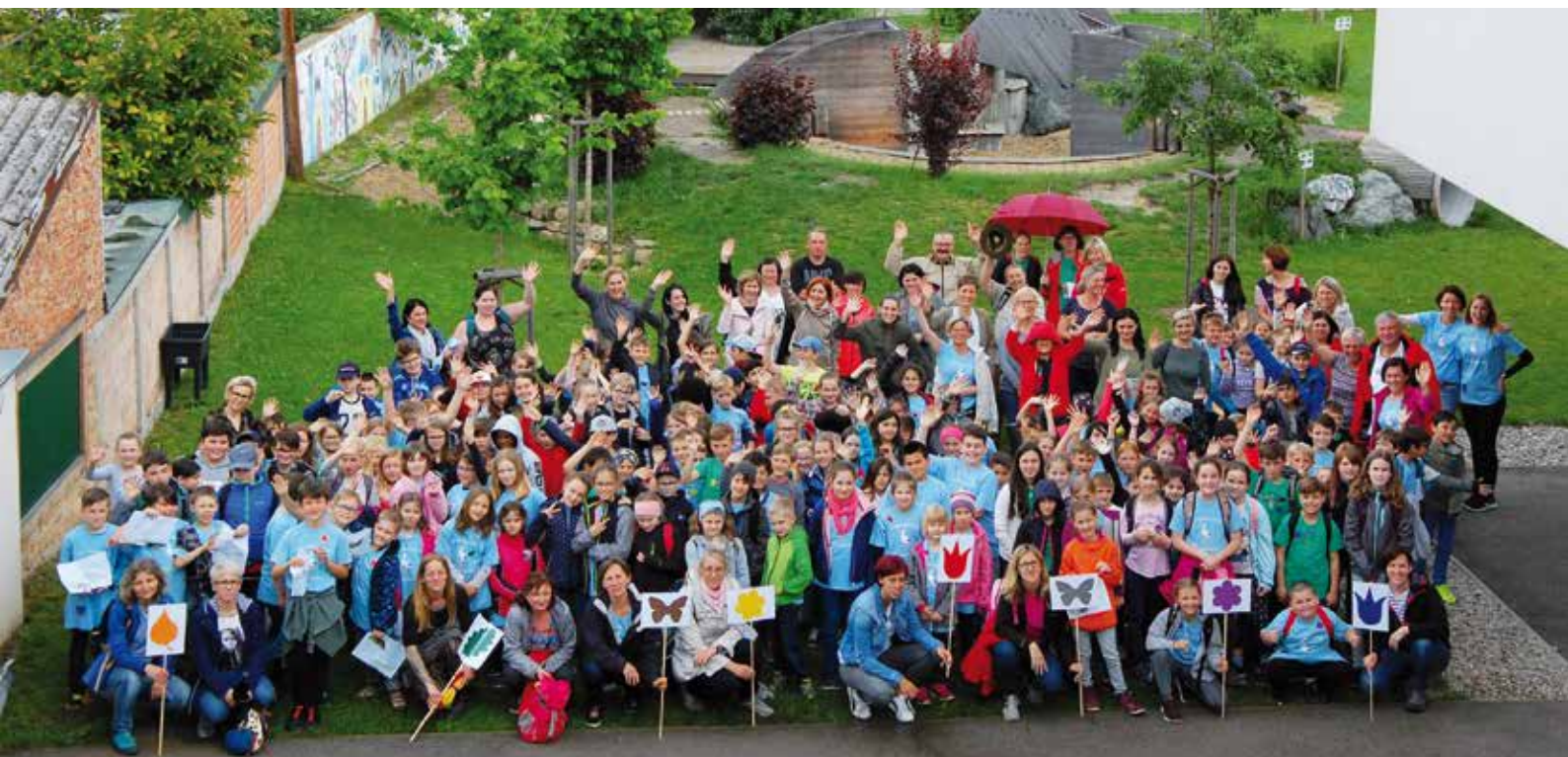
■ Die Kinder der vier Naturpark-Volksschulen bei ihrem Fest in Schattendorf

Naturparkbüro Schuhmühle Schattendorf Am Tauscherbach 1 A-7022 Schattendorf Telefon +43 (0) 664 4464 116 naturpark@rosalia-kogelberg.at www.rosalia-kogelberg.at