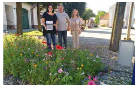
■ Naturspaziergang Mattersburg und Blühfläche in Rudersdorf

MIT UNTERSTÜTZUNG VON BUND, LAND UND EUROPÄISCHER UNION BUNDESMINISTERIUM FÜR NACHHALTIGKEIT UND TOURISMUS