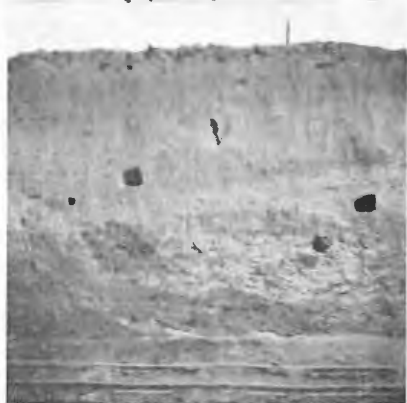
Abb. 2. Die Grenze zwischen der diluvialen und alluvialen Seseke-Terrasse. Unterhalb des Baumstubbens (Rotbuche) verläuft die Grenze schräg nach oben rechts. Links der Abhang zum alten Seseke-Bett.