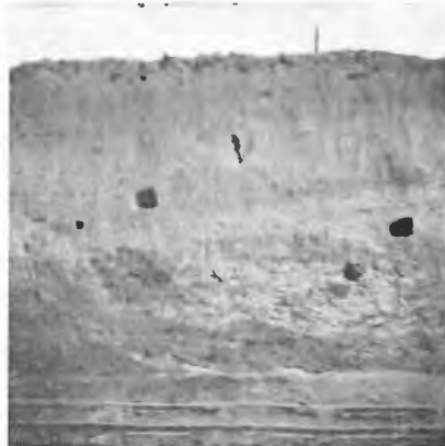
Abb. 2. Die Grenze zwischen der diluvialen und alluvialen Seseke-Terrasse. Unterhalb des Baumstubbens (Rotbuche) verläuft die Grenze schräg nach oben rechts. Links der Abhang zum alten Seseke-Bett.