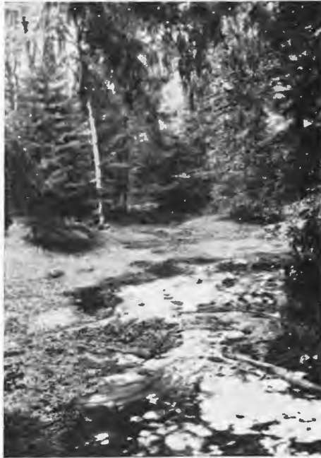
Abb. 3. Die Kummerbachquelle (N). Biotop von Planaria alpina

jedoch von Alpenplanarien in besonders hoher Dichte besiedelt ist. Hier, an der sog. Kummerbachquelle, die von Kopp (3) am Ende des 18. Jahrhunderts in liebenswürdigen Worten trefflich beschrieben ist, haben wir ein ganzes System von Quellen (Abb. 3), die in kleinen Trichtern senkrecht aus dem weißen Sand hervorsprudeln.