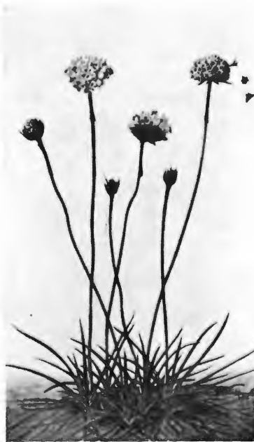
Abbildung 1: Gemeine Grasnelke ( Armeria vulgaris Willd.) Nach Tafel 41 in „Pflanzen der Heimat“ von Schmeil-Leick. Band 2. Leipzig. 1929.

Der Dortmund-Ems-Kanal hat sich in seinem nun gut fünfzigjährigen Bestehen zu einer Wanderstraße mancherlei Getiers und mancher Pflanzen entwickelt, die zuvor im Münsterlande ganz unbekannt