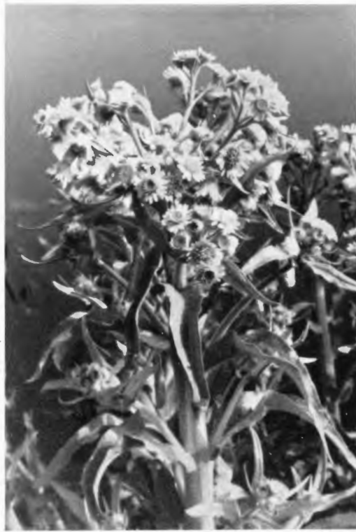
Doldenrispe des Moorkreuzkrauts