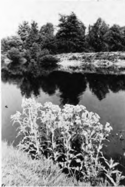
Das Moorkreuzkraut an der Ems zwischen Rheine und Mesum