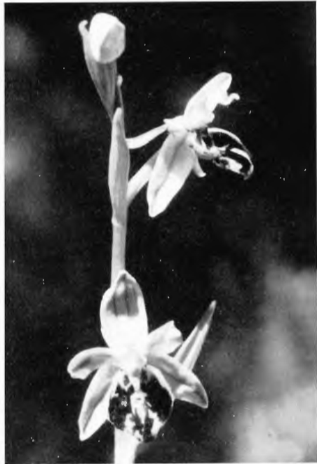
Abb. 5. Ophrys apifera . Teratologie mit nahezu runder, ganzrandiger Lippe.

Sind diese neuen Funde in Nordhessen nahe an der Grenze Westfalens schon aufregend genug, so war ich doch auch überrascht, als ich im Sommer 1961 bei einer Kontrolle der im Iserlohner Raum bekannten Fundstellen von Ophrys apifera einen Wuchsort aufsuchte und dort 7 Pflanzen vorfand, welche ausschließlich große Ähnlichkeit mit der var. friburgensis hatten. Es handelt sich hier um einen leicht nach Süden geneigten Hang auf Massenkalk mit teils dichter, teils lockerer Gebüschformation. Sicher ist hier die Variante an der nur mühsam zu erreichenden Stelle bisher unerkannt geblieben. Ein anderer Wuchsort, durch einen Taleinschnitt vom ersteren getrennt, war nur mit dem Typus Ophrys apifera besetzt. Die neu erkannten Pflanzen unterscheiden sich von der var. friburgensis durch die eirunden Sepalen, wie ich sie typisch von der Ophrys tenthredinifera kenne. Der Mittellappen der Lippe ist statt eines großen verlängerten Anhängsels wie beim Typus Ophrys apifera zugespitzt. Die Lippennebenlappen, ebenfalls zugespitzt, gleichen dem Mittellappen. Auffallend ist der sehr stumpfe und kurze Konnektivfortsatz, weshalb wir sie als f. brevirostra der var. friburgensis bezeichnen möchten (Abb. 6). Die Tatsache, daß sich auch eine Pflanze mit fast grüner