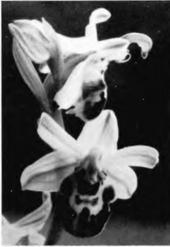
Abb. 6. Ophrys apifera var. friburgensis f. brevirostra (Kreis Iserlohn). Obere Blüte: Autogamie.

Lippe und weißem Perigon vorfand, spricht sicher dafür, daß es sich hier um eine, vielleicht durch klimatische Verhältnisse bedingte Verlustmutation handelt.