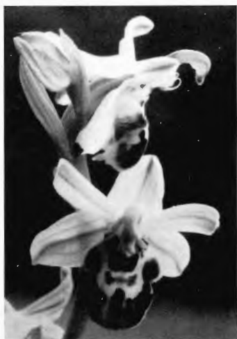
Abb. 6. Ophrys apifera var. friburgensis f. brevirostra (Kreis Iserlohn). Obere Blüte: Autogamie.

Lippe und weißem Perigon vorfand, spricht sicher dafür, daß es sich hier um eine, vielleicht durch klimatische Verhältnisse bedingte Verlustmutation handelt.