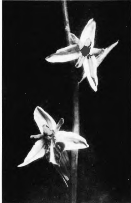
Abb. 7. Ophrys apifera , Teratologie: obere Blüte im Perianth vollkommen aktinomorph. Aufn.: Nieschalk

nete normale zweiseitig-symmetrische Anordnung vermissen: statt der Lippen hatten sich Kronblätter gebildet, welche nicht nur, wie man gelegentlich bei Mißbildungen des zweiten Kreises beobachtet, petaloid waren, sondern den beiden aurita -ähnlichen Petala vollkommen glichen. Von diesen vier Blüten hatten drei eine Säule entwickelt. Bei einer Blüte (der 4. von unten) war die Säule wie bei der untersten wieder dreifach. Diese Mißbildung, bei der das Perianth