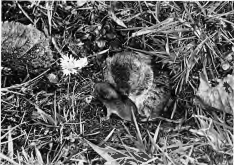
Abb. 1: Pitymys subterraneus : Muttertier mit 10 Tage altem Jungtier.

b) Die Oberseitenfärbung ist ein düsteres Wildbraun (agouti), das im Alterskleid etwas heller ist als im Jugendkleid. Die Unterseite trägt ein eintönig helles, silbrig schimmerndes Grau. Nur Jungtiere tragen bis zum ersten Haarwechsel die Unterseite ebenso dunkelgrau wie die Oberseite. Der Übergang von der Oberseiten- zur Unterseitenfärbung ist an den Flanken über eine schmale Zone hinweg gleitend. Die Schwanzfärbung entspricht in ihrer Zweifarbigkeit der der Körperober- bzw. -unterseite. Alle verglichenen, im Beobachtungsgebiet bisher gesammelten Exemplare sind untereinander dorsal bzw. ventral sehr übereinstimmend gefärbt, abgesehen von Fellanomalien, die durch kaudalwärts fehlende agouti-spitzige Grannenhaare entstehen, so daß nur die schwärzlichen Wollhaare erscheinen (vgl. Microtus arvalis ).