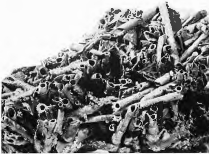
Abb. 1: Der Laerer „Piepstein“ besteht vorwiegend aus verkrusteten Schilfstengeln, die in dem damaligen Sumpfgelände wuchsen. Etwa 1 : 2

und leicht, daß sie im Mittelalter ein idealer Baustein für Gewölbekuppen waren. Häufig sind Phragmites - und Chara -Stengel in ihrer ursprünglichen Stellung „in situ“ inkrustiert worden. Eindrucksvolle Belege hierfür finden sich in dem örtlichen Heimatmuseum. Aber auch alles andere, was an Blättern und Früchten der Bäume, an Landpflanzen und tierischen Resten zusammengeschwemmt worden war, ist eingebettet worden.