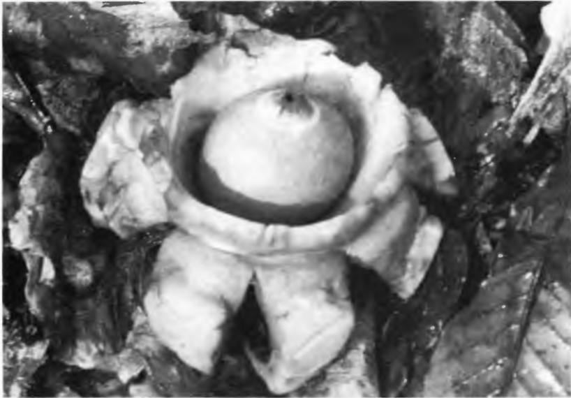
Abb. 3: Voll eröffneter Fruchtkörper des Halskrausen-Erdsterns ( Geastrum triplex ); innere Staubkugel (Endoperidie) mit ringförmigem Kragen (Halskrause) abgegrenzt.

Fundbeschreibung: 27.10.1982, zahlreiche Fruchtkörper in Form von Kugeln oder als entfaltete Sterne, in Buchenlaubstreu. Buchenwald auf Kalk; dicht südöstlich des „Hockenden Weibes“ in Nähe des aufgelassenen Kalksteinbruchs; südliche Kammseite des Teutoburger Waldes, Höhelage um 70-80 NN (MTB Ibbenbüren 3712/3).