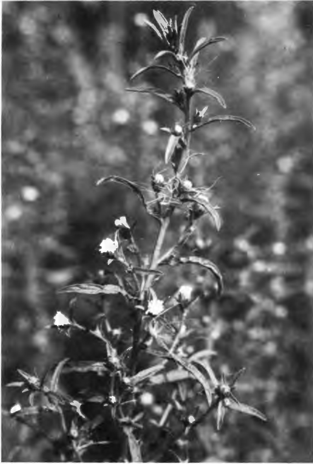
Abb. 1: Inula graveolens (L.) DESF., eine drüsig-klebrige bis 60 cm hohe Composite mit intensivem Geruch.

„1jährig, mit Pfahlwurzel; ohne sterile Blattrosetten; 20-60 cm hoch; auffällig riechend. Stengel oft schon vom Grunde an verzweigt, abstehend behaart (Haare dünn, mehrzellig) und drüsig-kleberig. Blätter beiderseits zerstreut behaart und drüsig-kleberig, mit hervortretenden Nerven, schmal lanzettlich, spitz, ganzrandig oder mit feinen aufgesetzten Zähnen, mit verschmälertem Grunde sitzend. Köpfe im Durchmesser 6-15 mm, in einer vielköpfigen Rispe. Äußere Hüllblätter drüsig-kleberig, lanzettlich, kaum 1mm breit, anliegend, die inner-