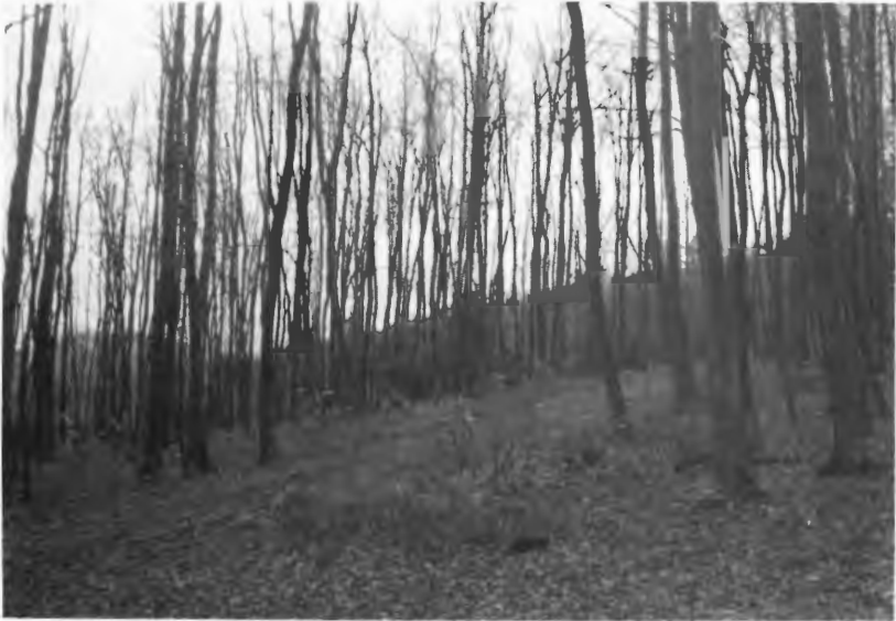
Abb. 1: Habitat von Nothocasis sertata bei Arnstberg Obereimer. Mischbestand von Eiche, Rotbuche und Birke. Eingestreut sind vereinzelt niedrige Bergahorn-Bäumchen.

chen fehlt. Die natürliche Flügelspannweite beträgt bei beiden Geschlechtern 27 bis 32 mm.