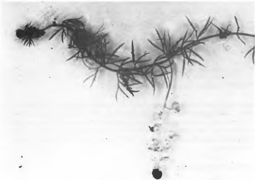
Abb. 2: Belegexemplar von Utricularia ochroleuca aus dem NSG „Langenbergteich“ (leg. et det. B. Esser, Oktober 1985)