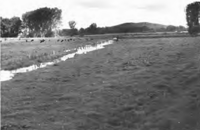
Abb. 3: Unterlauf des Kinderbaches (Abschnitt U 2 ) – intensive Grünlandnutzung bis in den Uferbereich