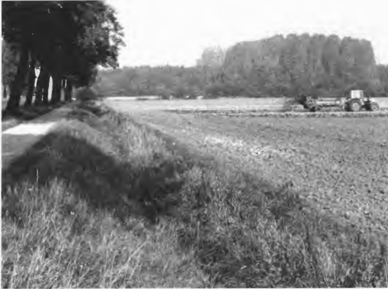
Abb. 2: Oberlauf des Kinderbaches (Abschnitt C) – Düngeinsatz auf den angrenzenden Ackerflächen