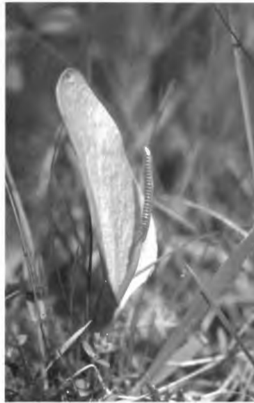
Abb. 1: Ophioglossum vulgatum mit dem ährenartigen Sporangium

Die Gewöhnliche Natternzunge, ein heute selten anzutreffender, kleiner Farn, ist in Moorwiesen und feuchten, lückigen Magerwiesen zu Hause (OBERDORFER 1994). Die Lichtpflanze ist ein Wurzelkriecher und gilt als Molinion -Verbandscharakterart. Ihre Hauptblütezeit ist von Juni bis August. In der Roten Liste NRW (LÖBF 1999) wird der Geophyt als gefährdete Art geführt. Da die Pflanze oft nur 5 bis 10 cm groß wird, ist es wichtig, dass die Bestände niedrigwüchsig und offen bleiben (SEBALD et al. 1993).